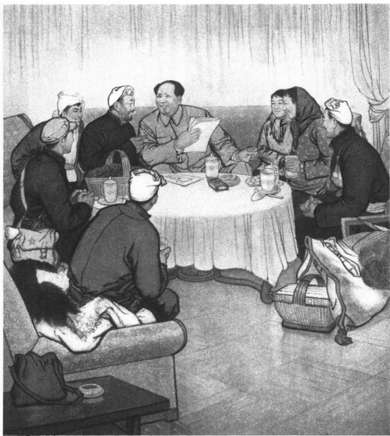
1 延安儿女心向毛主席