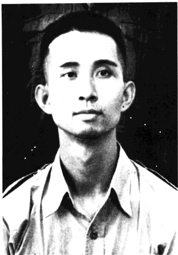
澳門四界救災會理事兼 回國服務團團長廖錦濤烈士像