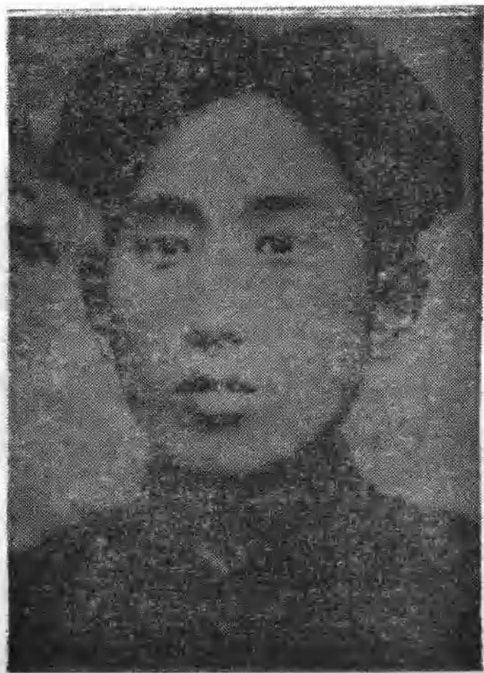
樊 振 庭 烈 士