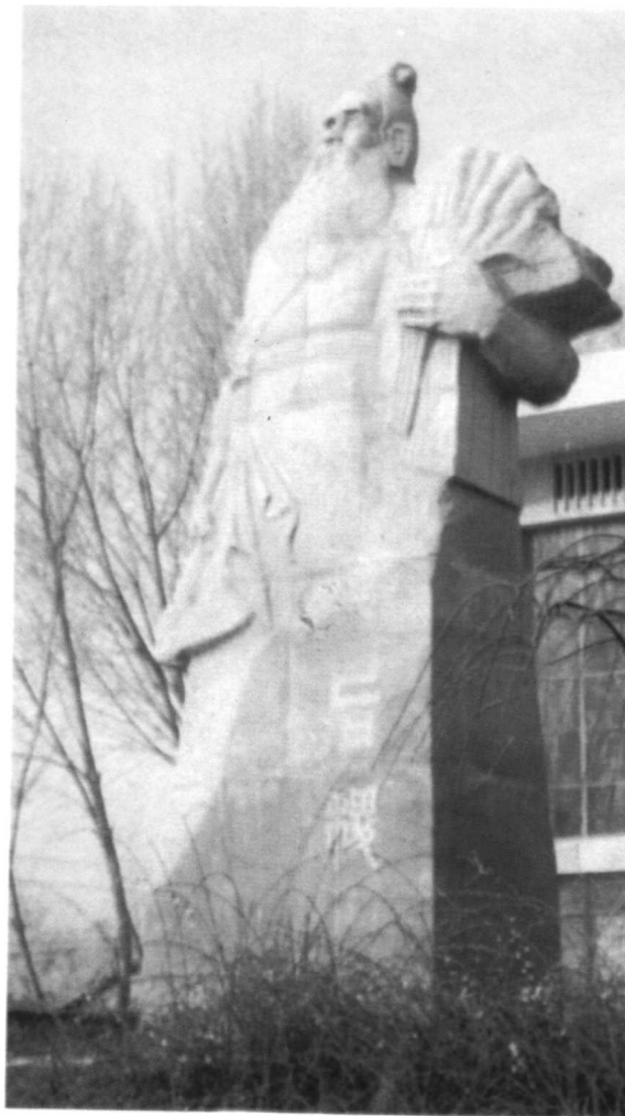
陕西武功后稷塑像