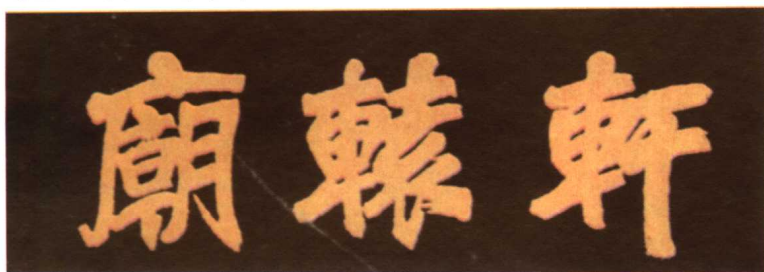
蒋鼎文所书“轩辕廊”匾额