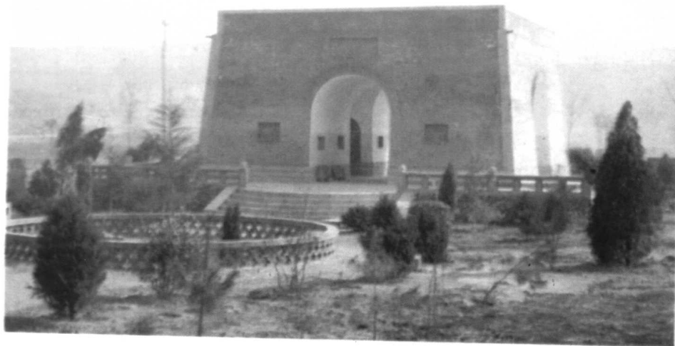
陕西武功后稷教稼台