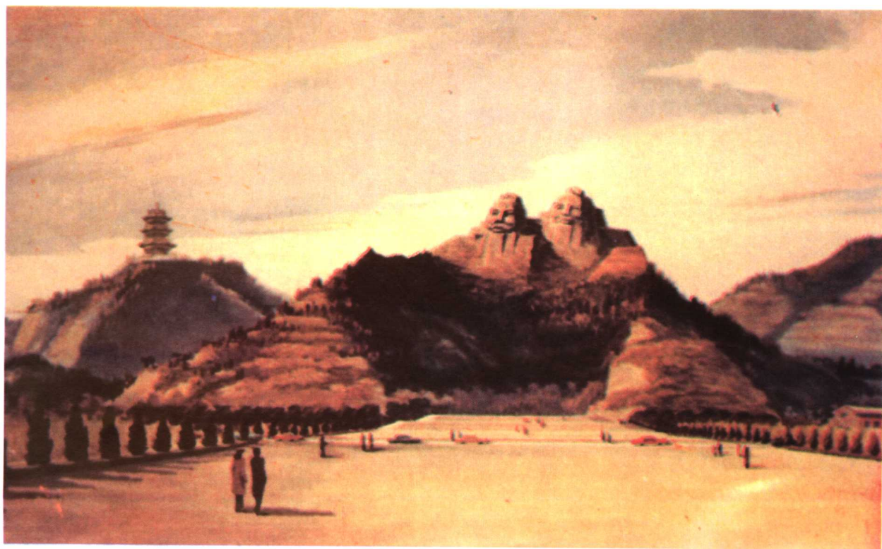
河南郑州黄河游览区向阳山炎黄二帝塑像 （像高106米，为世界上最高的塑像）