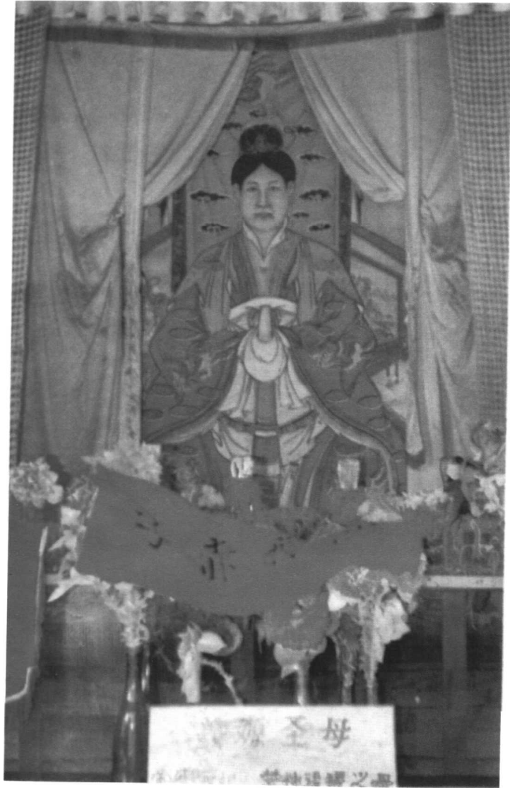
陕西岐山周公庙内姜嫄圣母塑像