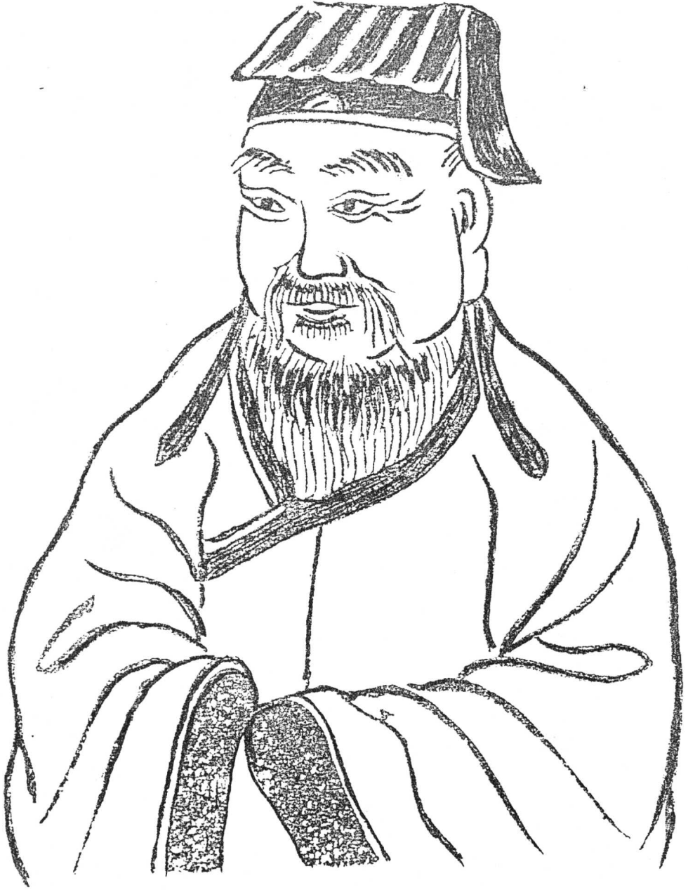
姬姓始祖 后稷公像