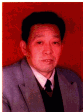
县人大常委会党组书记 郭敬法