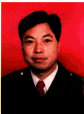
统战部副部长 马斌