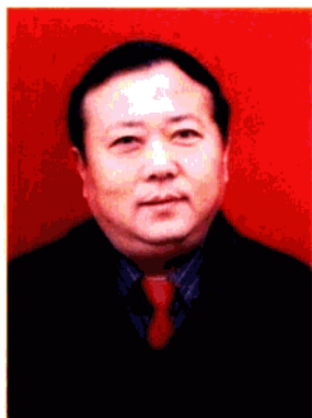
县长助理 高中 县农开办主任