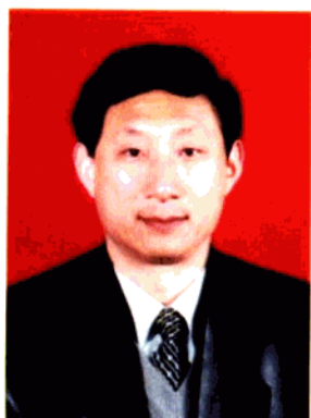
县人民政府副县长 邱冲