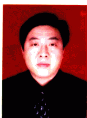
县人民政府副县长 曹志军