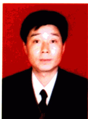
县人大常委会副主任 李国胜