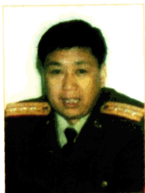
县委常委、武装部政委 姜同焕