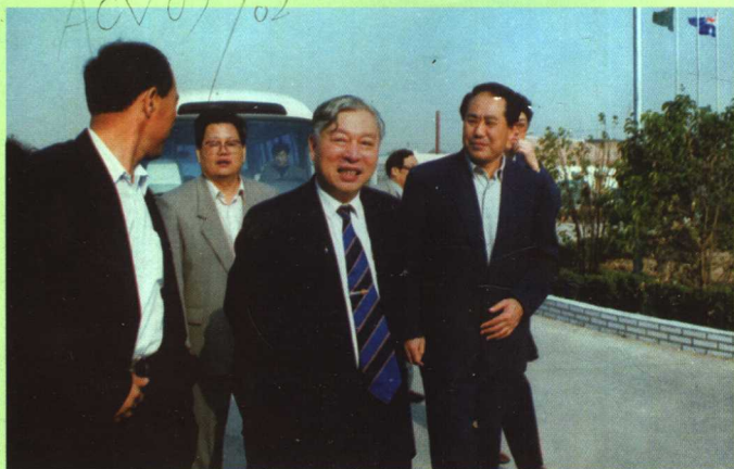
鸽场 国家科委领导同志视察莘县光华