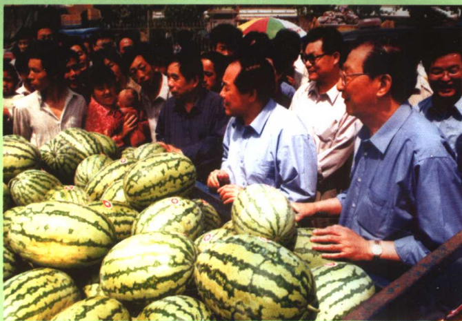
西瓜市场 山东省政协主席陆懋曾视察莘县