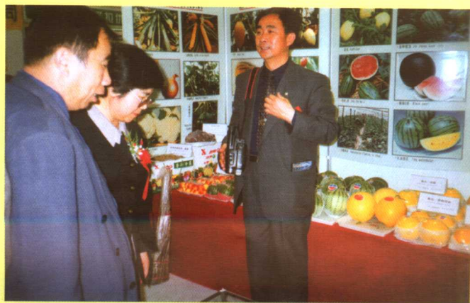
◀ 莘县展台 二〇〇〇年寿光蔬菜博览会