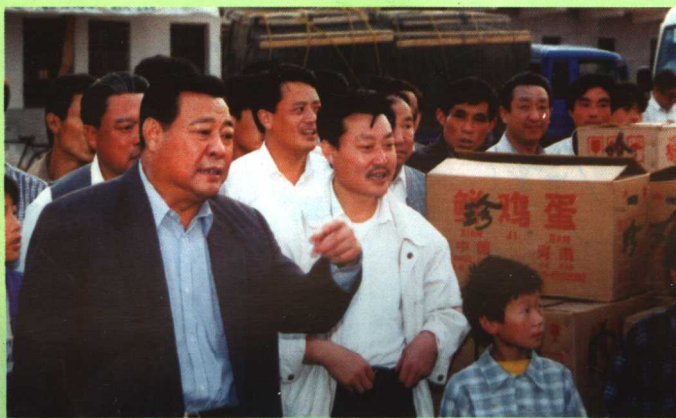
鸡蛋市场 山东省省长李春亭视察莘县