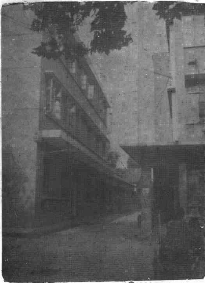
◁ 粮食局招待所 一角（左）