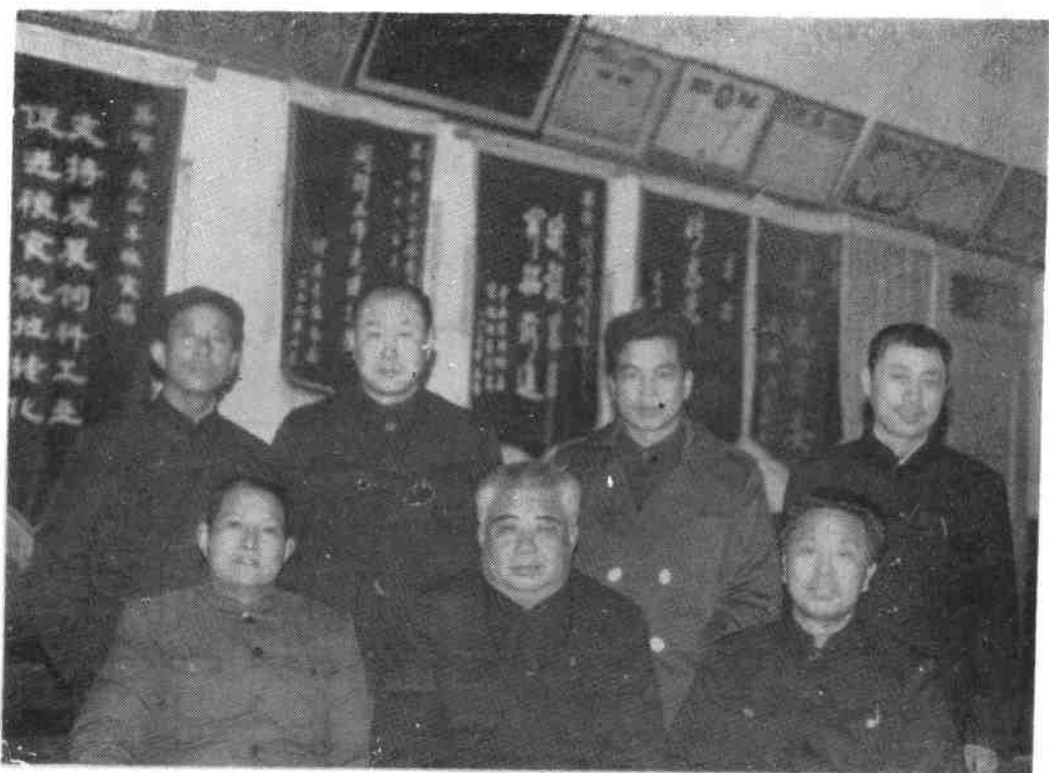
△ 粮食局党、政领导成员合影