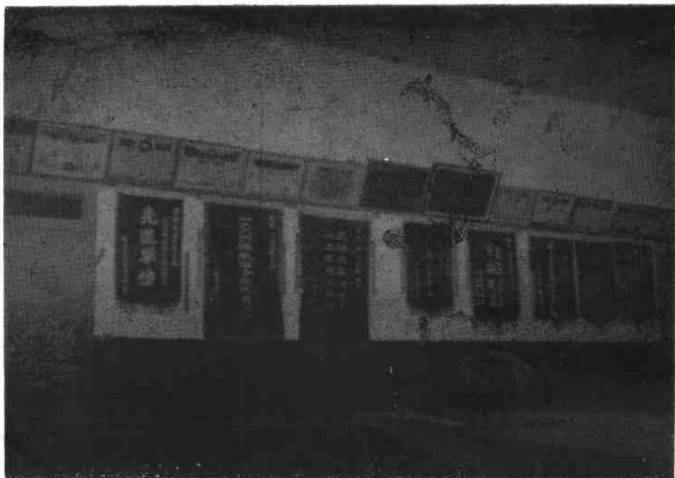
△ 粮食局荣获的部分奖状和锦旗