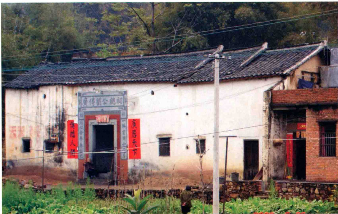
我族入粤二世祖广传公祠，位于广东兴宁岗背镇。图为二00六年三月二十六日，浸校塘村的宗亲在祭祖时拍摄的照片。