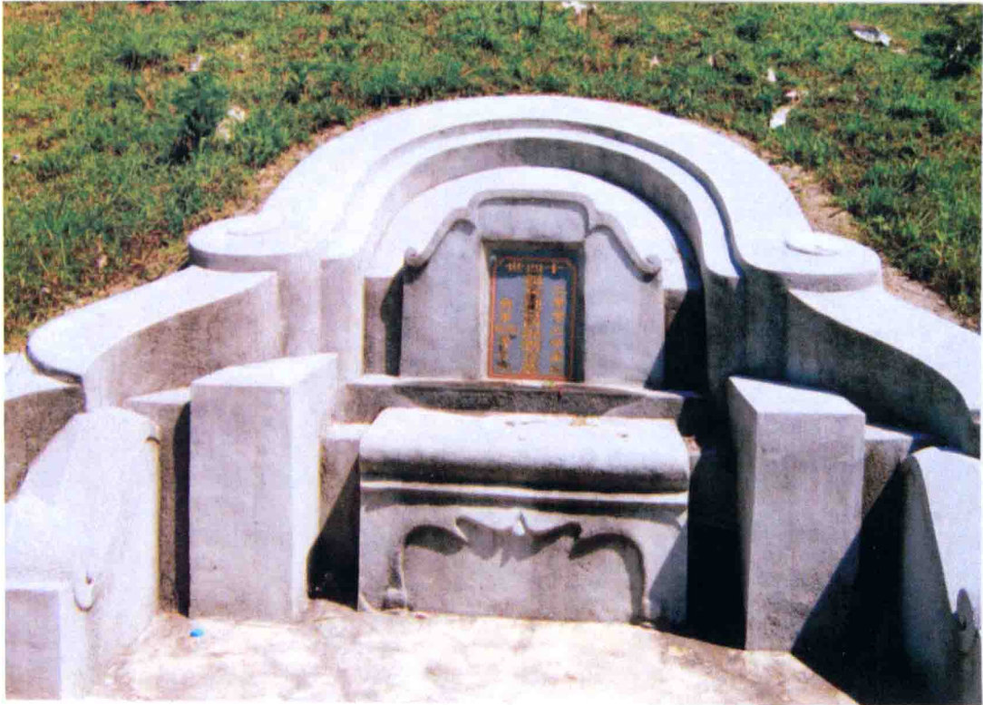
图为十四世祖文仰公祖墓于 2003 年冬重修后的情景。（此墓地在原地陆河县新田镇）