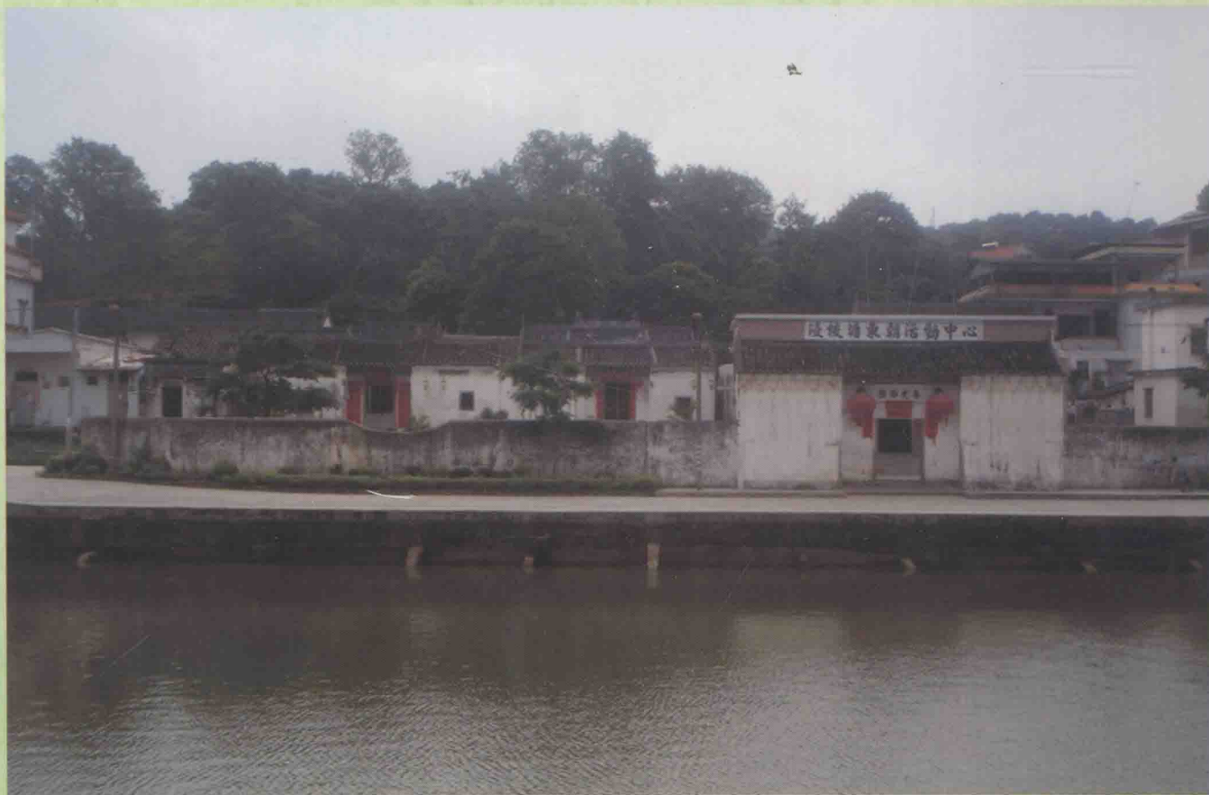
图为浸校塘刘氏开基立村的繁衍发展中心，立村后，刘氏门楼、宗祠、东朝学校也建于于此地域。