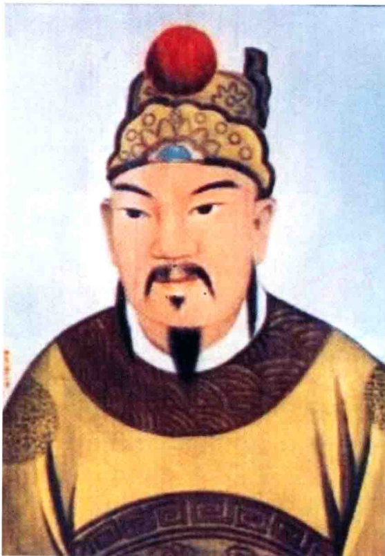
东汉末蜀国开国主刘备像