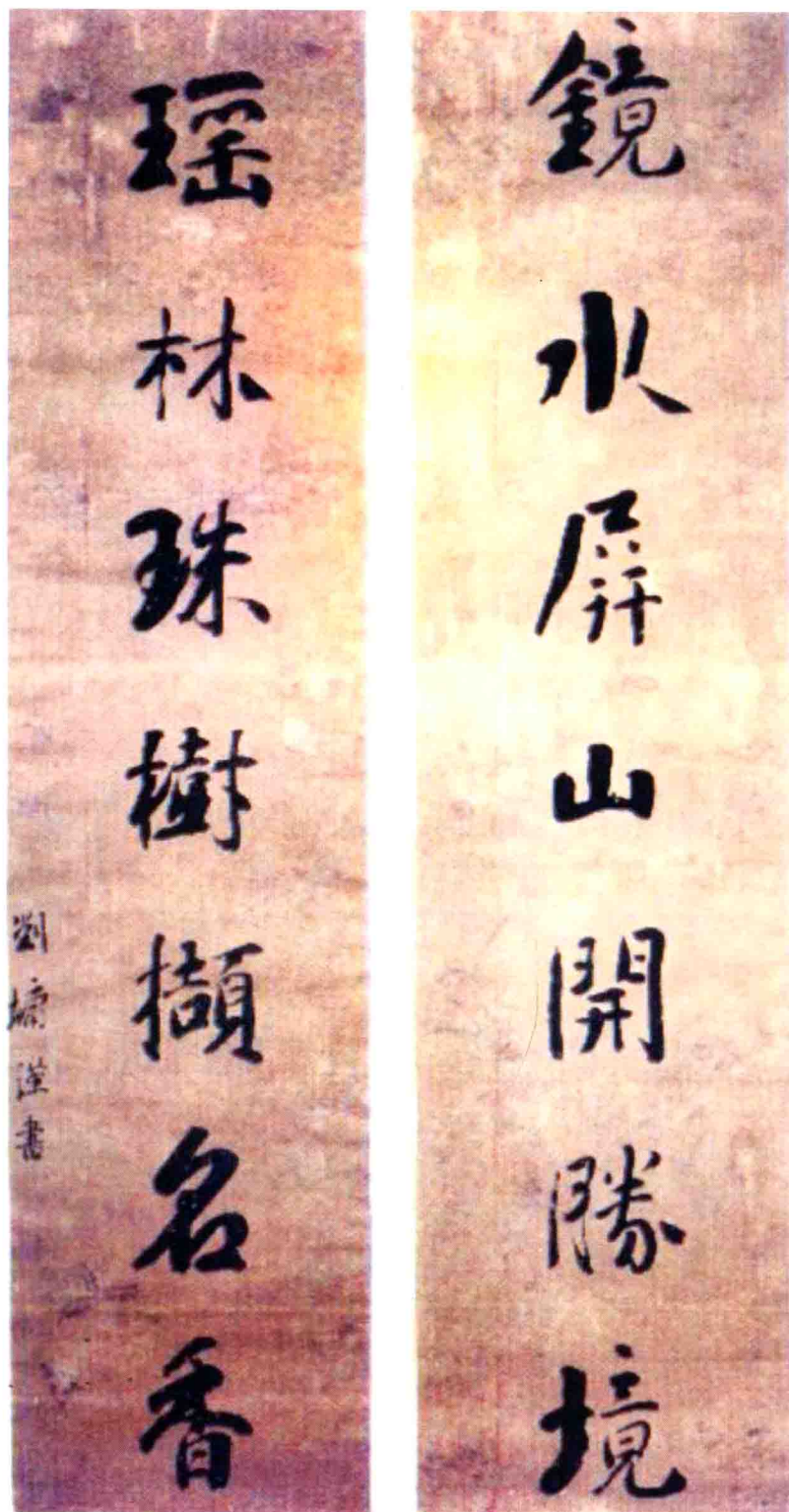
图为刘墉大学士真迹《七言联》

刘墉是中国历史上著名廉吏之一，同时诸城刘氏家族在清朝的“康乾盛世”时期，以刘统勋、刘墉、刘鐸之祖孙三公二宰相，轰动朝野，成为中国文坛文学创作百用不厌的历史题材。