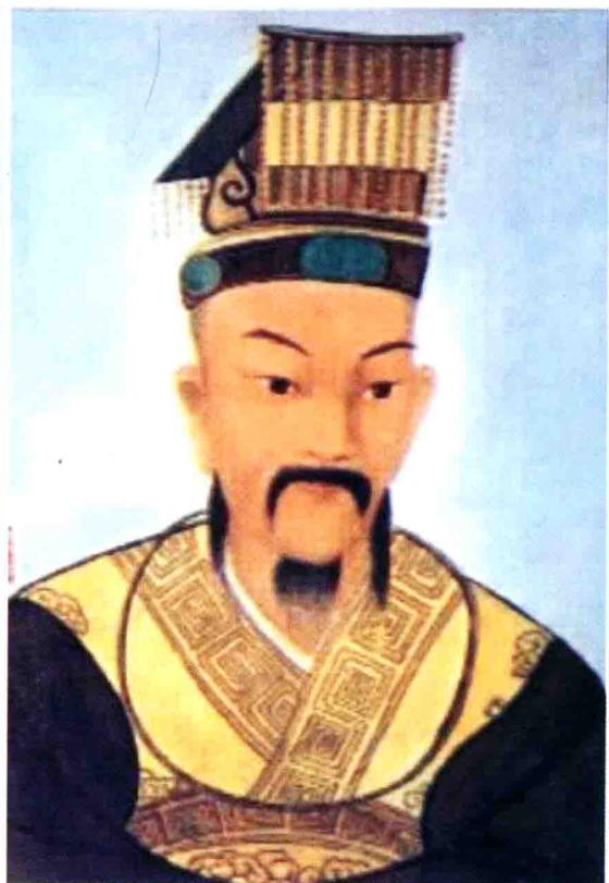
西汉开国皇帝高祖刘邦像