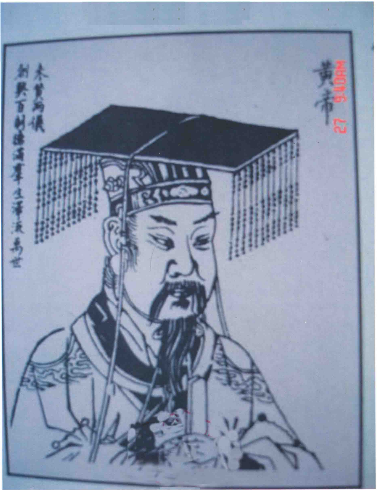
中华民族始祖轩辕黄帝像