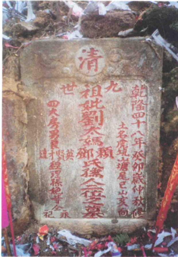
图为浸校塘村十五世祖东朝公赖氏、邓氏二妣合墓碑。 下图为坐山局向。墓在陆河县新田镇虎山尾。