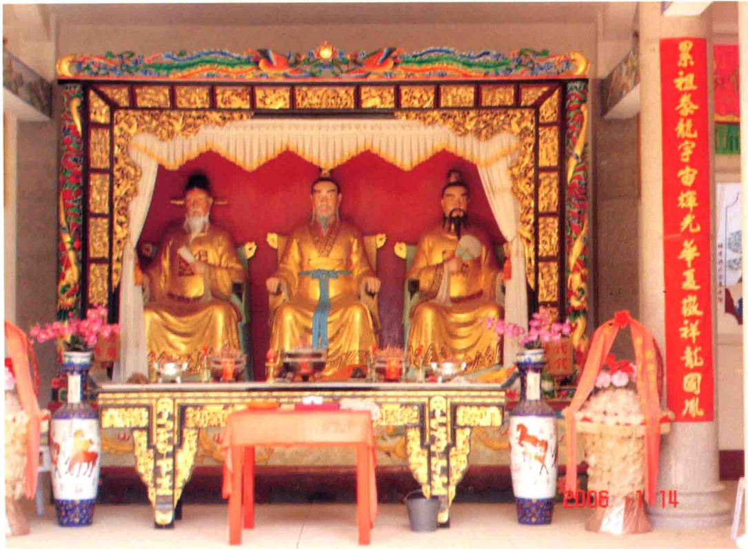
二00六年一月十四日，浸校塘村组织宗亲前往揭西潭下村寻根问祖，参观刘氏展览馆时拍下的照片。中间者为累公，右为开七公，左为广传公。