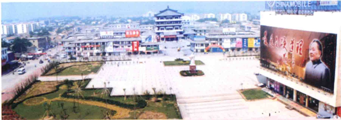
劉邦廣場廣場全景圖