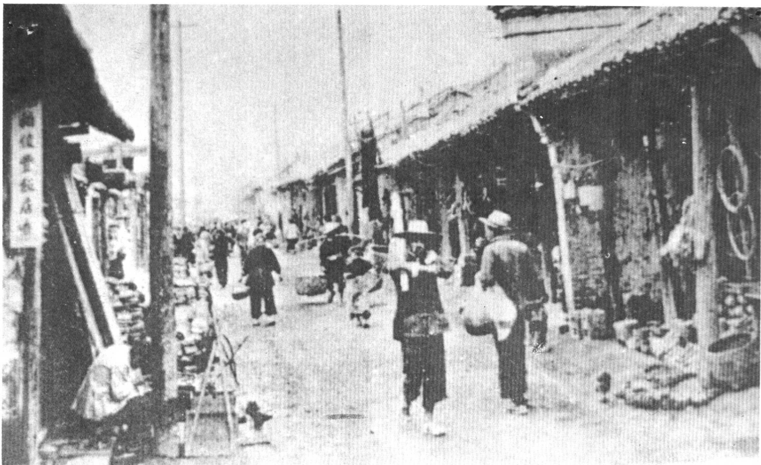
图1 合肥城旧街道—前大街。

此间，合肥地区在外地求学的进步青年，经常给家乡寄来《资本论》、《响导》、《新青年》等书刊，传播马克思主义。接着一批共产党员、青年团员又奉命回肥开展活动，在合肥地区播下了革命火种。