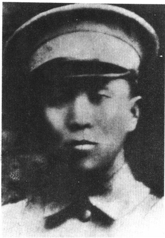
图5 崔筱斋，合肥北乡崔小圩人，1924年加入中国共产党，1932年6月英勇就义。