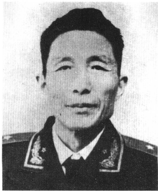
图6 曹广化，寿县人，1925年加入中国共产党。1985年离休，离休前任中央军委纪律检查委员会副书记。