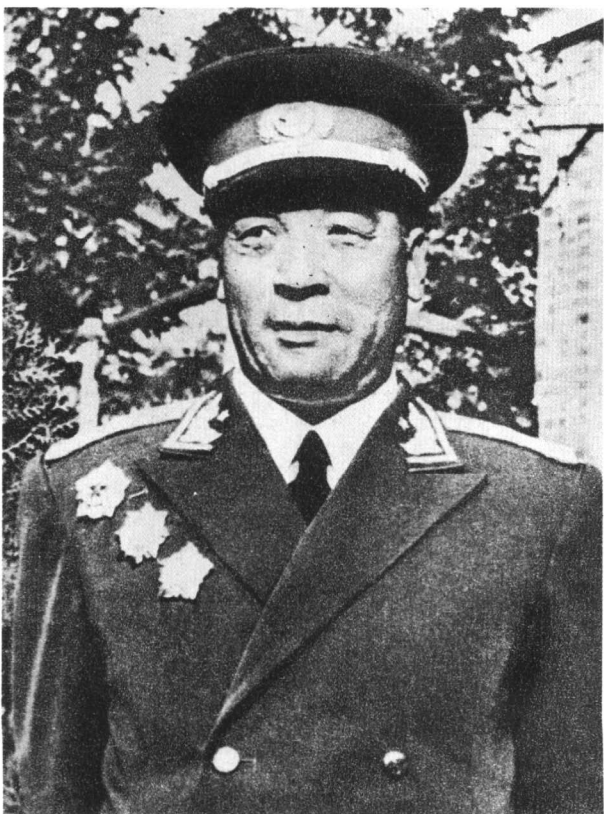
图10 聂鹤亭，阜南人，1926年吴山庙暴动后加入中国共产党。1955年被授予中将军衔，曾任中国人民解放军装甲兵副司令员。1971年病逝。