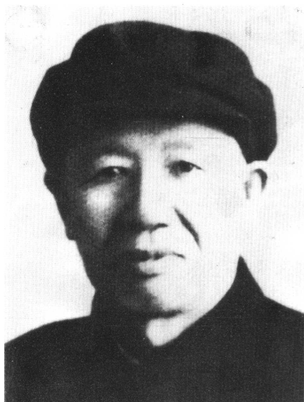
图9 李云鹤，寿县人，1925年加入中国共产党。建国后，曾任安徽省政协第一副主席，1969年1月逝世。