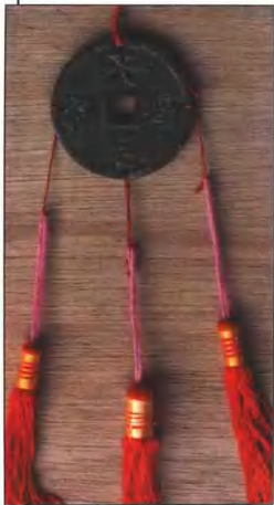
清“天后赐福，永保平安”压胜钱