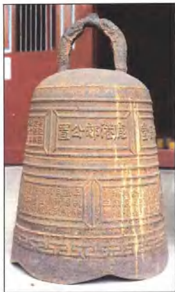
清代“鹿港郊公置”铁钟