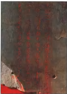
明镇殿妈祖玉圭铭文