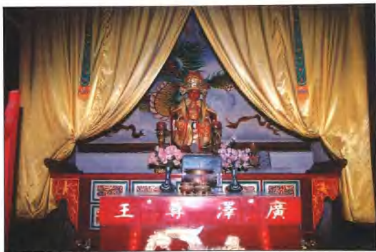
正殿广泽尊王神龛