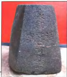
清“泉郡福苏宁糖砵”