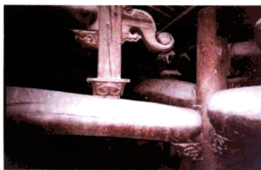
上程祠堂屋顶柱梁结构(明代)