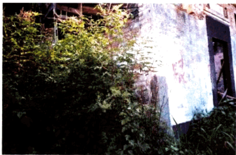
環蓮嶺蓮花庵 (清代)