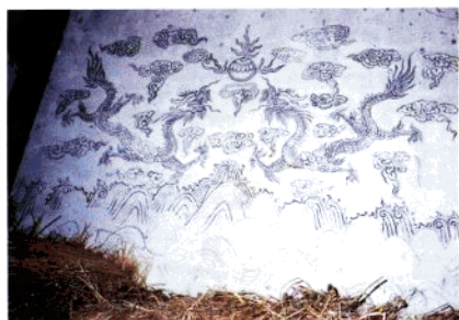
上程社庙龛座上的壁画——双龙戏珠