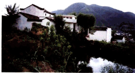
上村龍勝庵 (庵前厅已作了改建)