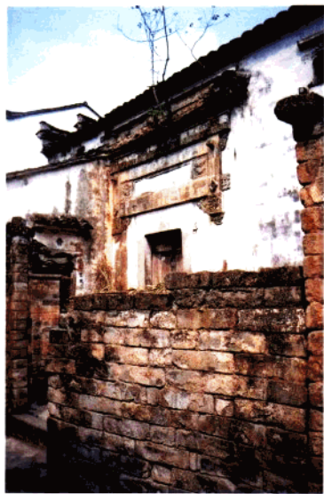
西村方氏祖宅（明代）