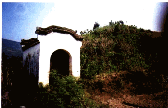
上村大冲亭 (清光绪三十一年)