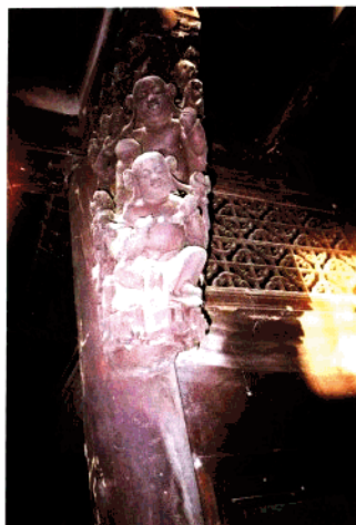
上祈吴淡如宅梁驮木雕 (清末)