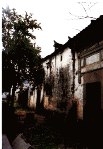
梅干(家)村老宅——三堂屋(明代)