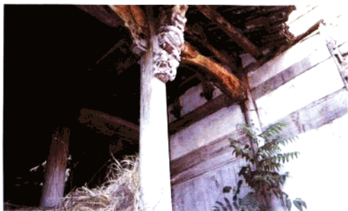
汪村潘氏宗祠内景 (明代)