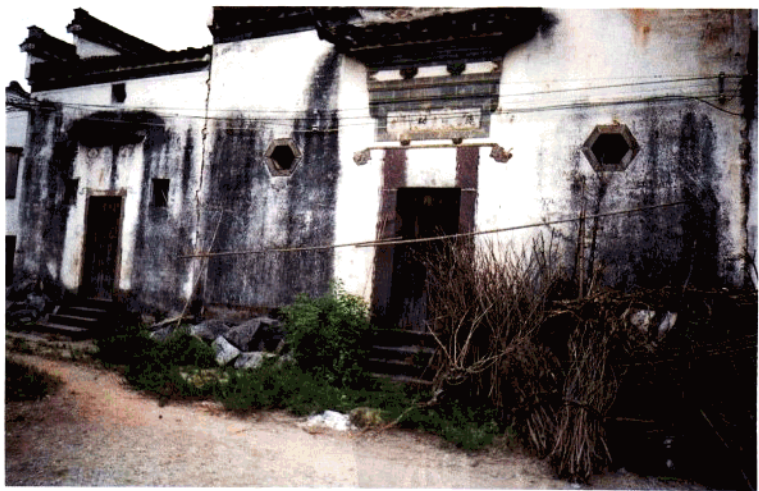
上、方祈村吴姓“秦伯社庙”（民国）