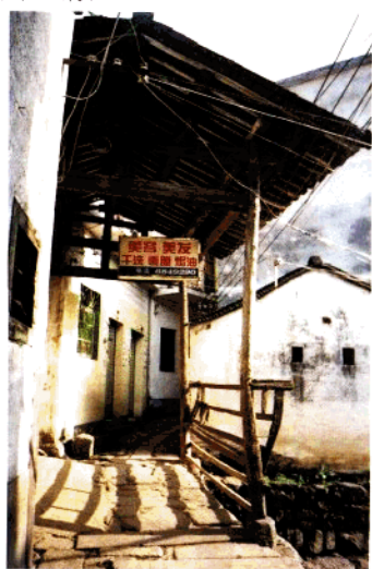
安宁（人）桥亭（清光绪二十三年）