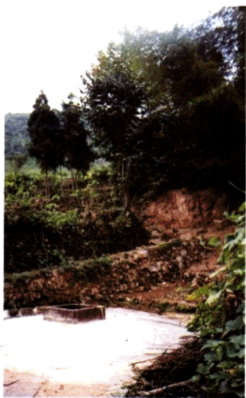
上井:内—上、方祈吴姓始居地