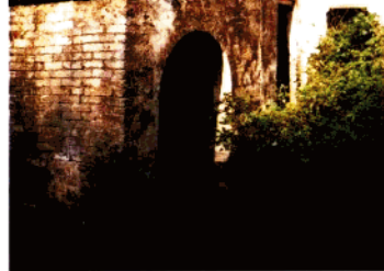
外为环联岭路亭（清·光绪三十四年） 里为黄连凹亭（清·乾隆五十九年）