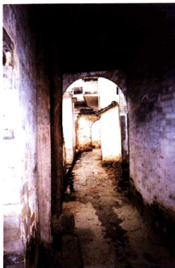
水步头老屋阁（明代）