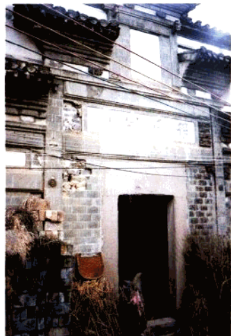
上祈程氏宗祠(明代)