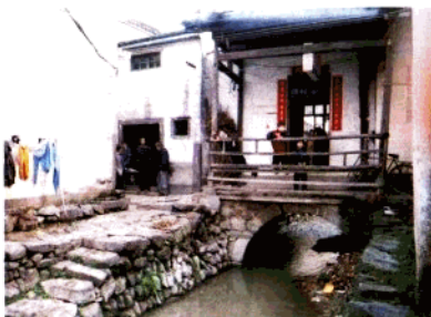
方祈村安宁（人）桥（清）