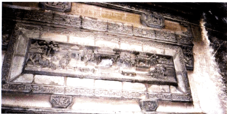
上祈吴含章厨房门楼砖雕（清）