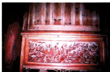
方祈吴四发宅木雕窗衣(民初)

康熙(子翁余老亲台七秩华诞寿序正面序文。此寿屏每块为266cm × 47.2cm × 1.5cm 共计12块。序文1300多字，堆漆画中46个人物。