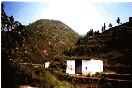
上、方祈大坑口亭 (里为观音亭)