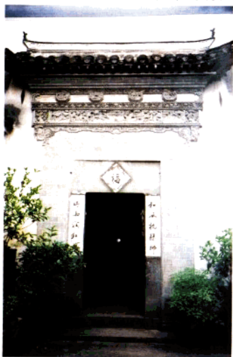
方祈吴四发宅门楼（民初）