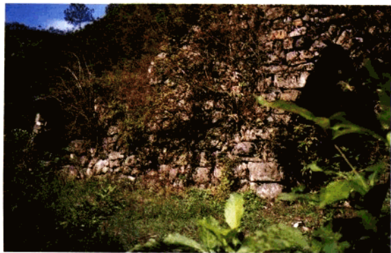
大坞五亭坑石灰 灶(窑)及石头亭