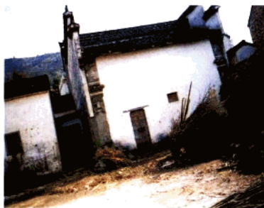
上、方祈吴姓椽公祠(前厅, 大门已拆, 改建)