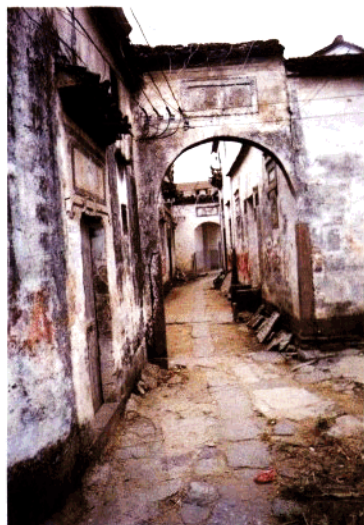
方祈村竹林里（明代）