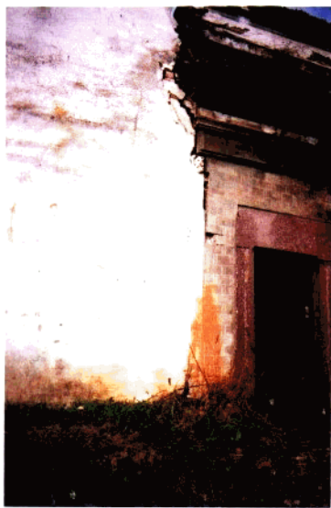
上村坑口老宅（清·咸丰元年）