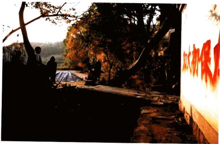
汪村水口桥（清·康熙丙午年）