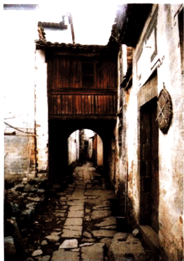
上村致雄巷跨街楼（明代）