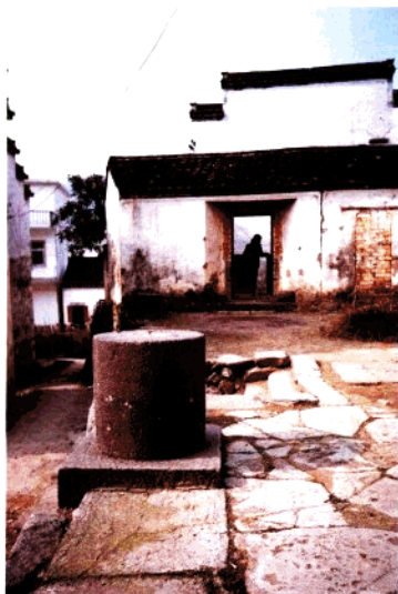
上村王家祠堂前的旗杆墩