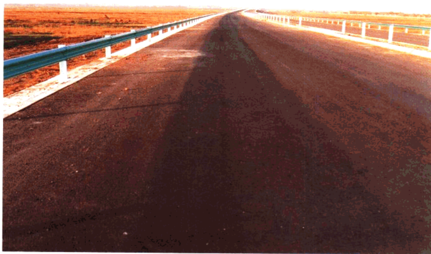
环胶州湾高速公路