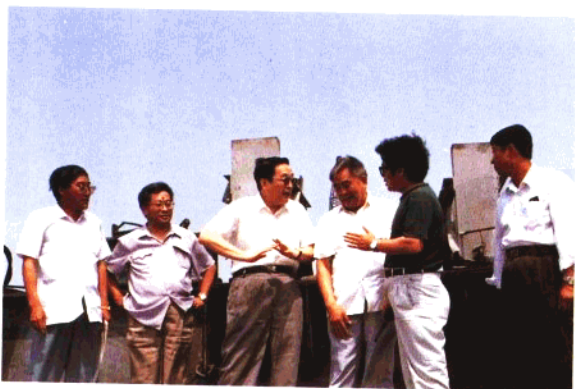
中共青岛市委书记俞正声到跨海大桥视察工作