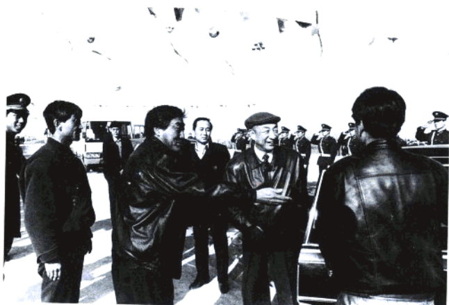
国务院副总理部家华视察青岛交通工作