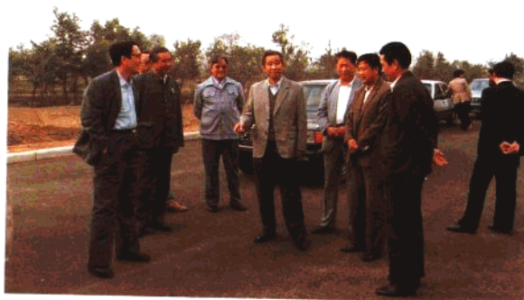
交通部原副部长王展意、副部长李居昌视察青岛公路建设