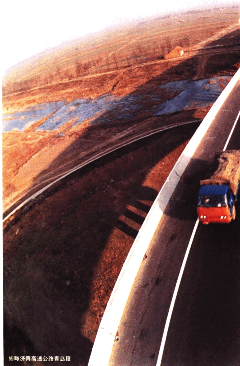
俯瞰济青高速公路青岛段