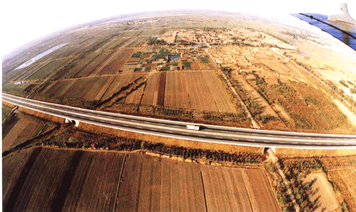
济青高速公路青岛段鸟瞰