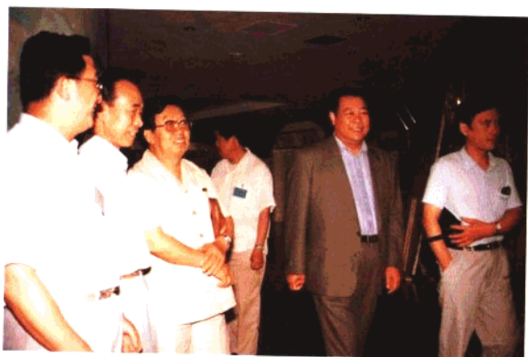
山东省副省长李春亭视察青岛交通工作