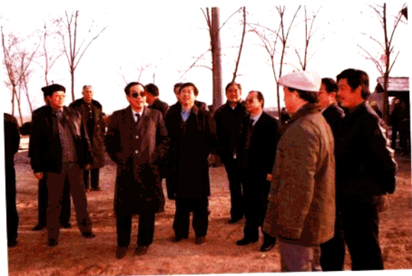
山东省副省长张瑞凤在青岛市副市长李乃胜等人陪同下视察公路建设