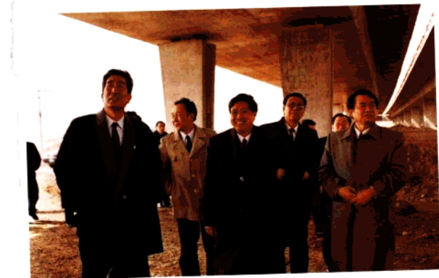
青岛市人大主任孙秉岳等领导在环胶州湾高速公路视察工作