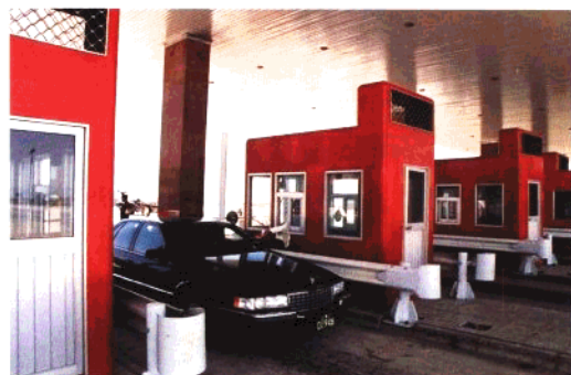
济青高速公路西元庄收费站