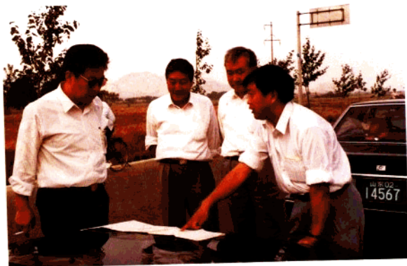
青岛市副市长王增荣听取公路规划情况汇报