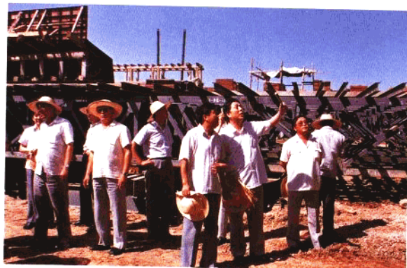
青岛市代市长秦家浩视察公路施工现场