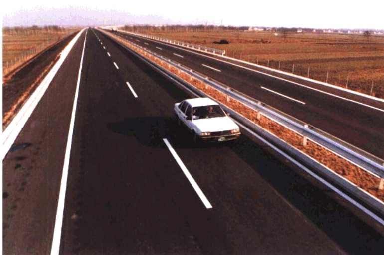
济青高速公路青岛段