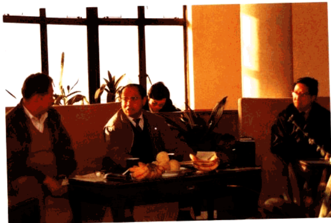
交通部部长黄镇东在市交通局听取汇报