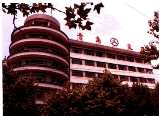
青岛市交通局办公楼