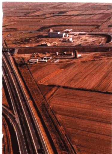
济青公路兰村立交桥