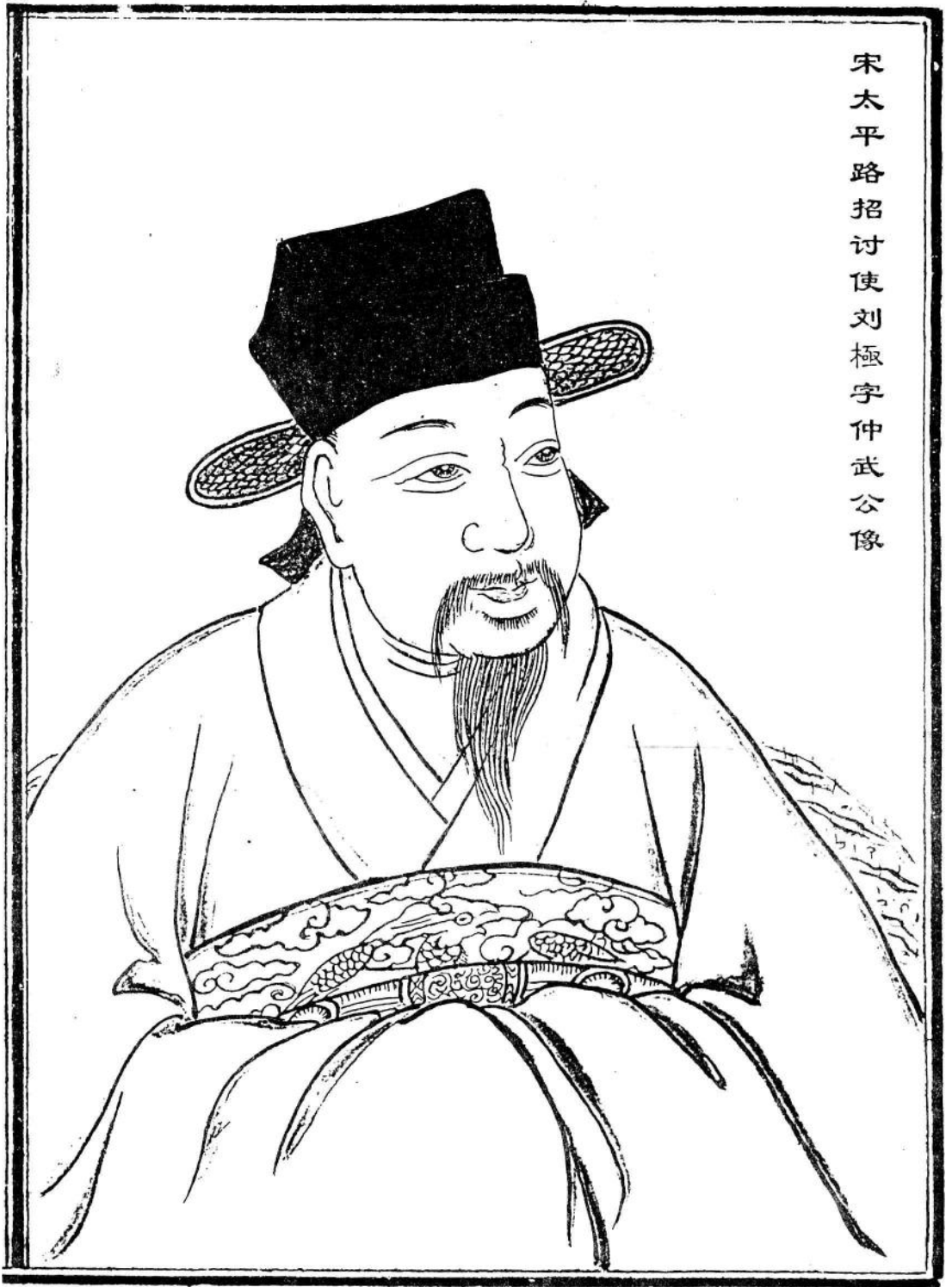
宋太平路招讨使刘极字仲武公像