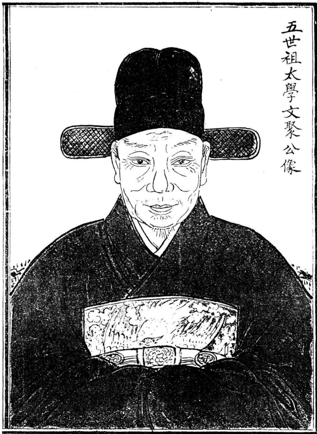
五世祖太學文聚公像