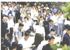
中共中央总书记、国家主席、中央军委主席江泽民视察江村