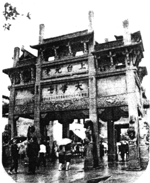
许国石坊 歙县

累的宗祠和不少民居均饱含劫难的酸辛。我曾在游览黟县西递时有所感悟，为何这里的民居保存这么完整？想必因其过去是“官宅”、“商宅”，整个村子贫富悬殊很小，住宅与住宅，人心与人心都很少有不平衡滋生。加上世外桃源之境，古文明又全是自己的祖上所为，在荣耀心理与行动支配下，对待“文化革命”采取