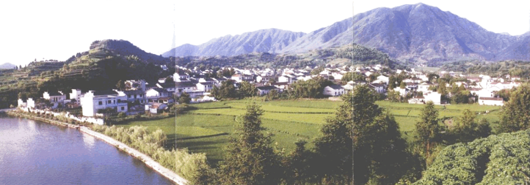
中国历史文化名村 · 江村