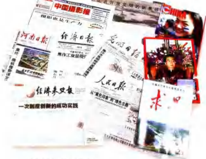
焦作成为各大媒体关注对象