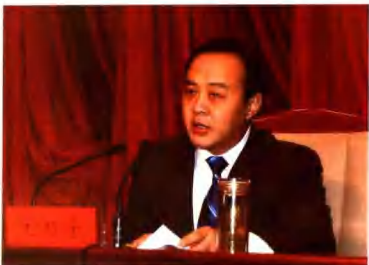
中共焦作市委副书记、市长 毛起峰

经过50年的风风雨雨，焦作市迎来了自己光輝的50岁生日。值此喜庆的日子，中共焦作市委党史研究室、焦作市档案局、焦作市摄影家协会通过一年多的努力，联合编纂出版了《焦作五十年》大型画册。本书集历史性、资料性、艺术性于一体，图文并茂，全面展示了焦作建市以来特别是改革开放以来经济、政治、文化、社会各项事业全面发展的辉煌成就。它的出版，对宣传焦作对外形象，提高焦作知名度，激发全市人民解放思想、干事创业的热情，必将产生广泛而深刻的社会影响。