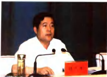
中共焦作市委书记 市人大常委会主任 钱代生