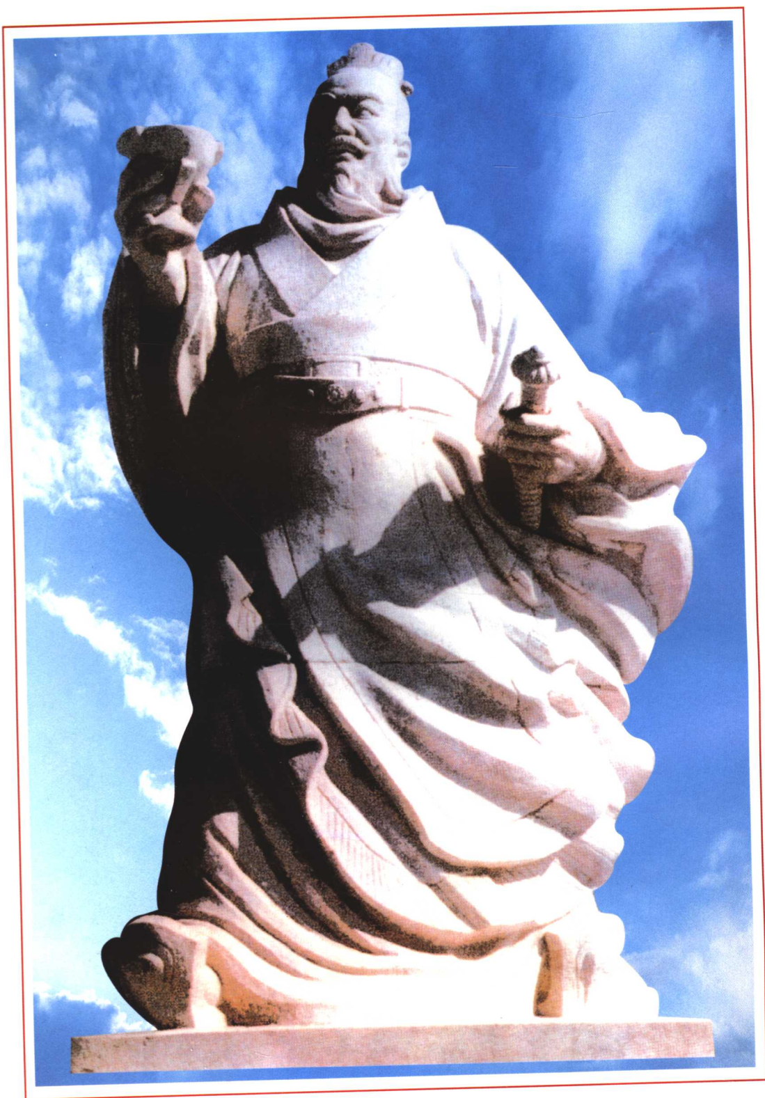
高祖劉邦漢白玉塑像