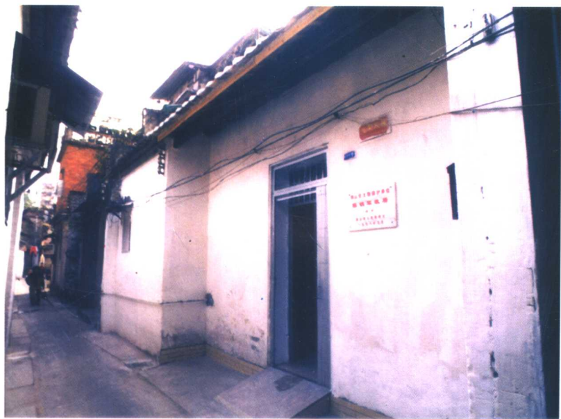
陈铁军故居(今佛山市禅城区福宁路善庆坊6号)