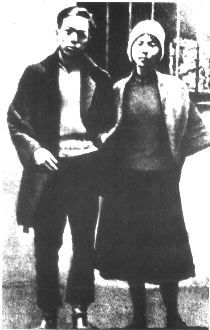
一九二八年二月六日，陈铁军与周文雍就义前在监狱铁窗下的合影