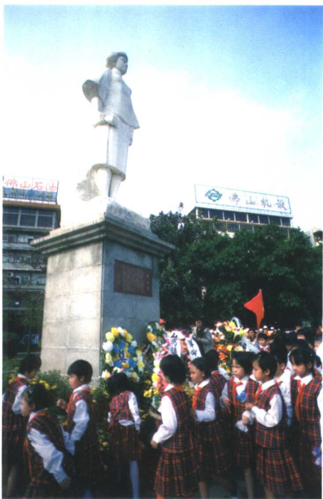
铁军小学师生每年清明节都到铁军公园缅怀先烈