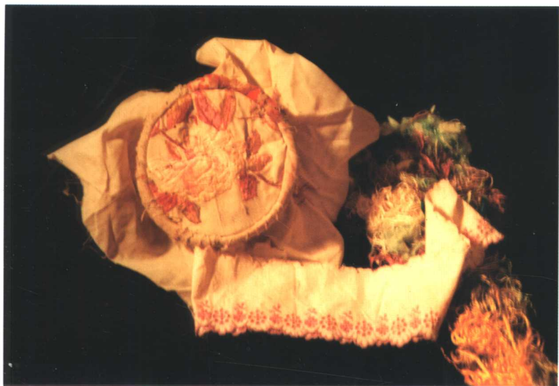
陈铁军少时制作的绣花手工品