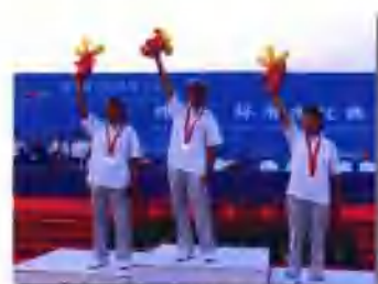
第三届全国体育大会水球比赛女子(赤脚) 四川队包揽金银铜牌