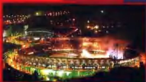
四川省第十届运动会开幕式