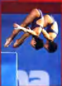
两朵小花曾繁和滕若琳在多哈亚运会跳水女子双人10米台比赛中轻松夺冠