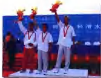
第三届全国体育大会水球比赛男子(赤脚) 四川队包揽金银牌