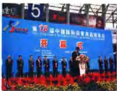
第十八届中国国际体育用品博览会开幕盛典