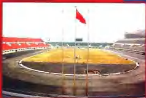
四川省第十届运动会主会场——达州体育中心