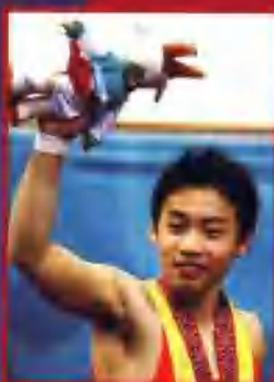
邹凯夺得亚运会体操男子自由体操金牌