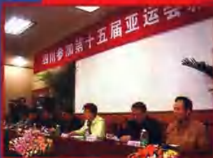
省体育局通报第十五届亚运会四川运动员参赛情况