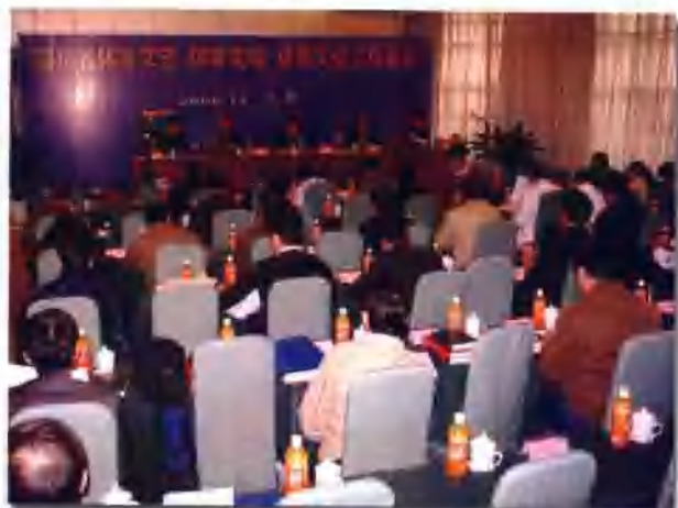
四川省体育文史 体育文物 体育文化工作会议