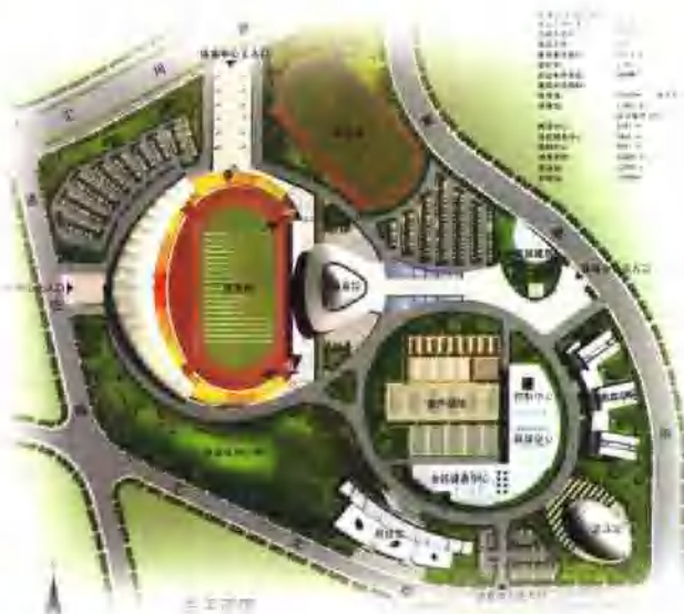
第十一届省运会主赛场——自贡南湖体育中心平面图