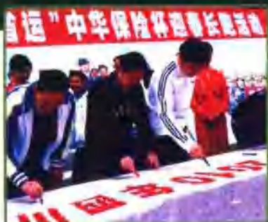
市级领导亲临万人长跑签名活动