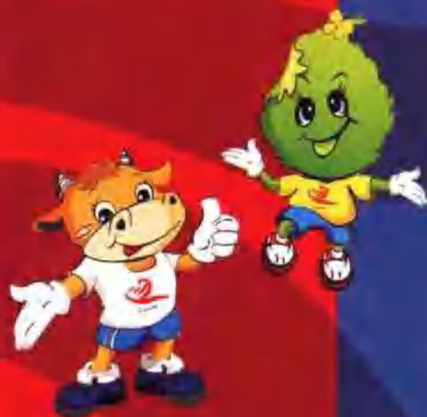
四川省第十届运动会吉祥物——“达达”“旺旺”