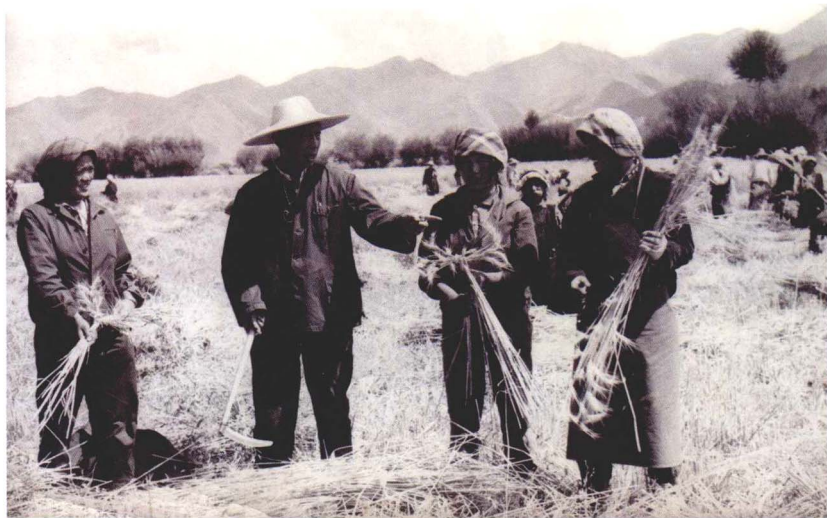
1977年三届政协主席罗铭在城关区了解农民秋收情况