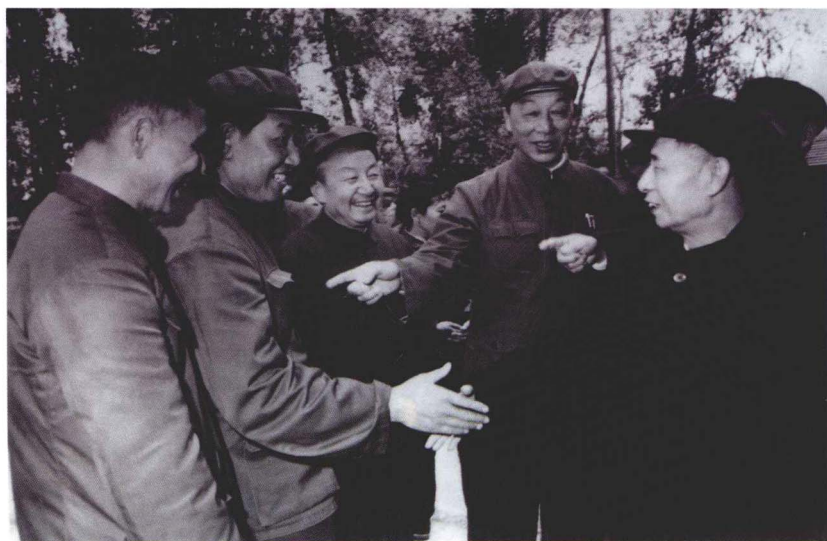
1980胡耀帮同志在拉萨了解拉萨市领导班子情况。右（一）为胡耀邦、右（二）为罗铭