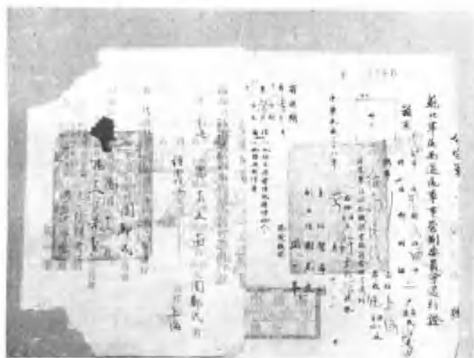
1949年2月3日南通全境解放，我厂印刷的《新华电讯》和军管会的有关证件。