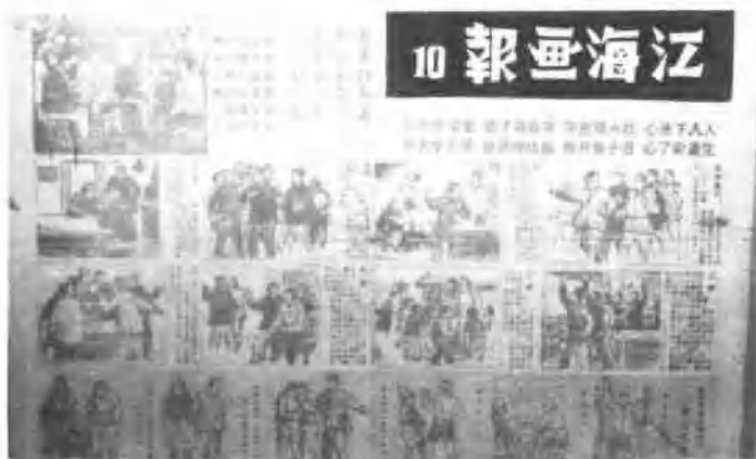
在解放区用石印机印刷的彩色画报。