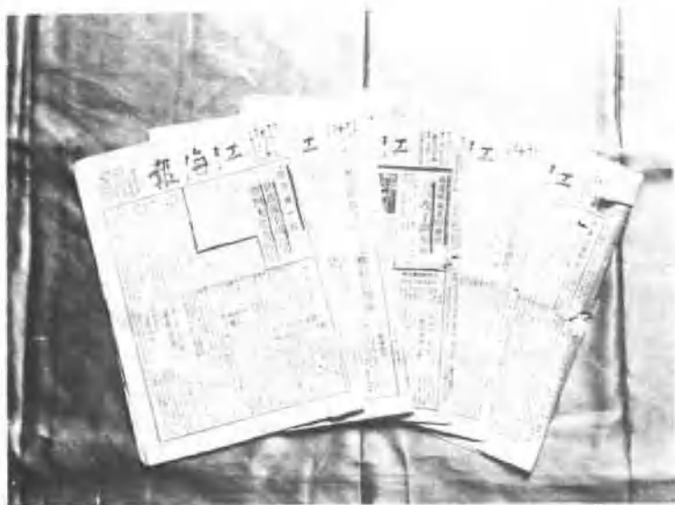
用四开脚踏机印刷的《江海画报》。