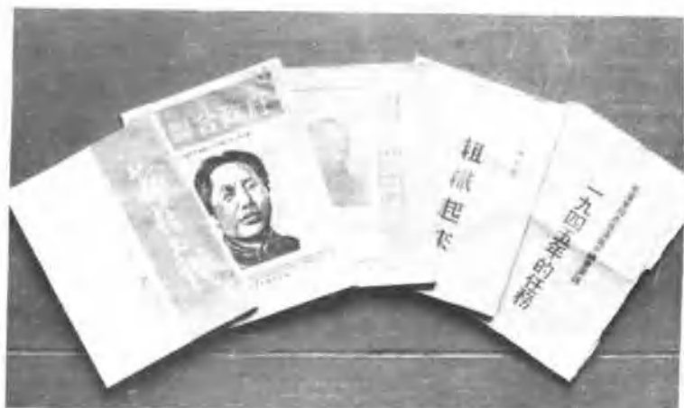
在抗日战争和解放战争中我厂印刷的部分毛主席著作。