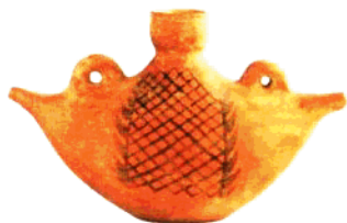
北首岭陶塑人头像(新石器时代) 北首岭网纹船形壶(新石器时代)