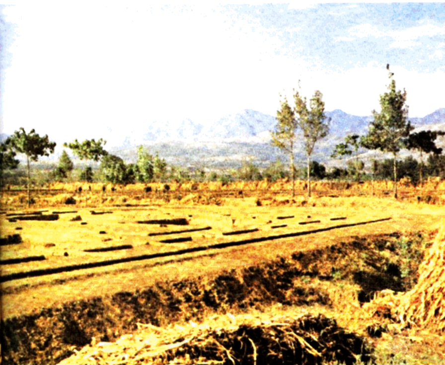
周原凤雏宗庙建筑基址