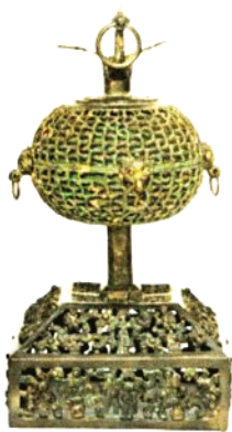
凤鸟衔环铜熏炉(春秋)