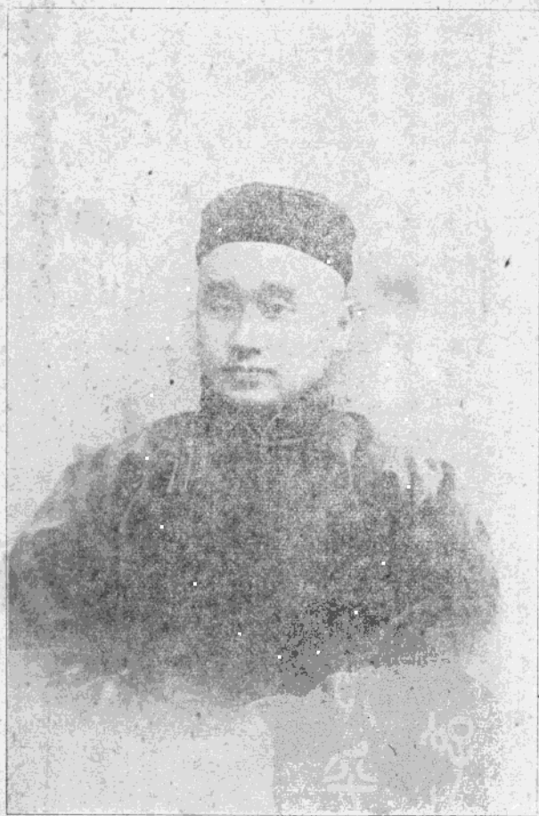
3776 像肖生先給維徐會書教聖督基國中海上前