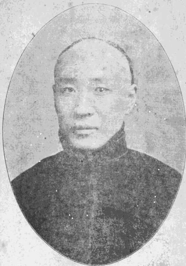
3937 影小馥蓮柴陽信者輯編