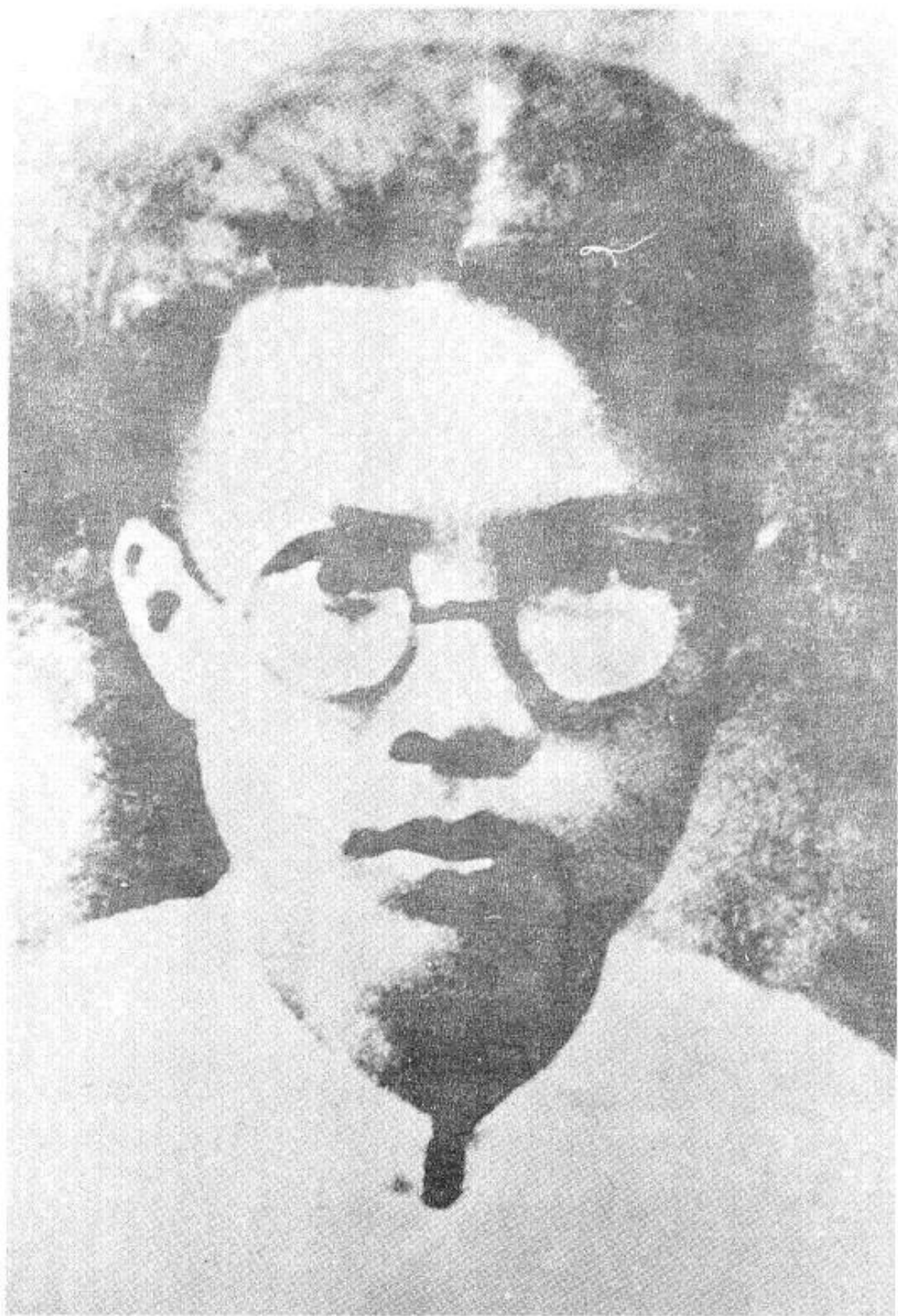
抗日时期中共广西省工委书记钱兴。