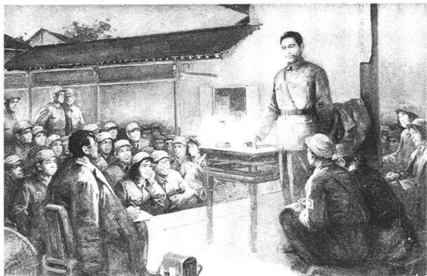
一九三九年一月，周恩来在路莫村救亡室作抗日形势和任务的报告。