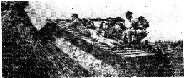
设在房顶上的我军机枪阵地

在敌众我寡、敌人火力又占优势的情况下进行防守，特等射手起的作用特别大。一连有个班长伏在工事后面，连放七枪，竟打倒了七个敌人。二连副连长一枪就打死了敌人的机枪手。