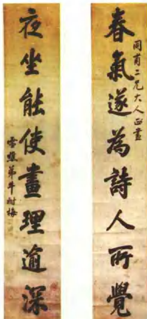
清·牛树梅书法作品