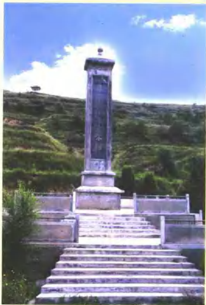
县城南屏山革命烈士纪念碑