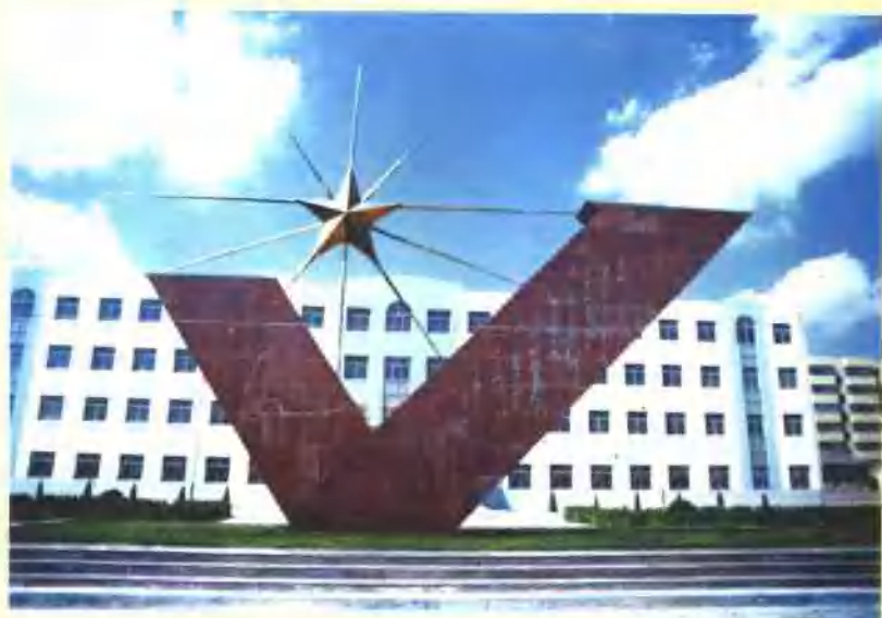
县城文庙街小学毛泽东《七律·长征》诗纪念碑