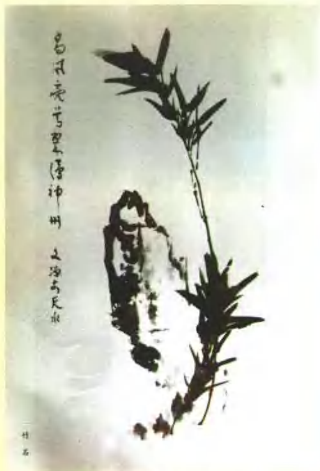
“陇上画师”张维垣作品