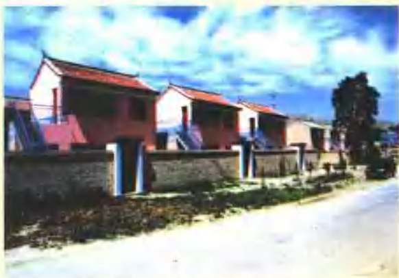
碧玉乡小康示范村