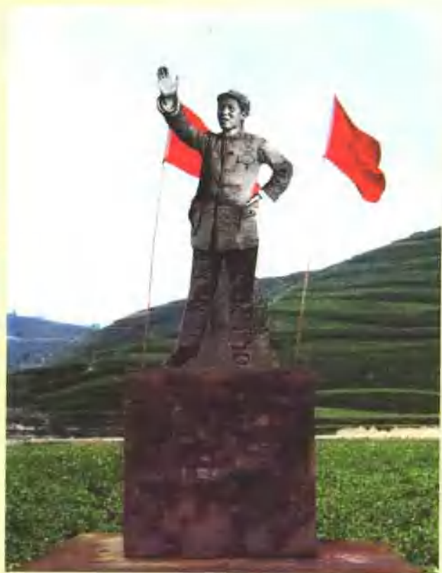
榜罗镇瞭望台毛泽东雕像