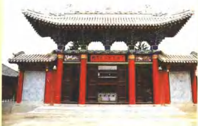
省级文物保护单位——榜罗长征纪念馆