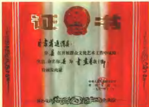
中国书画艺术之乡证书