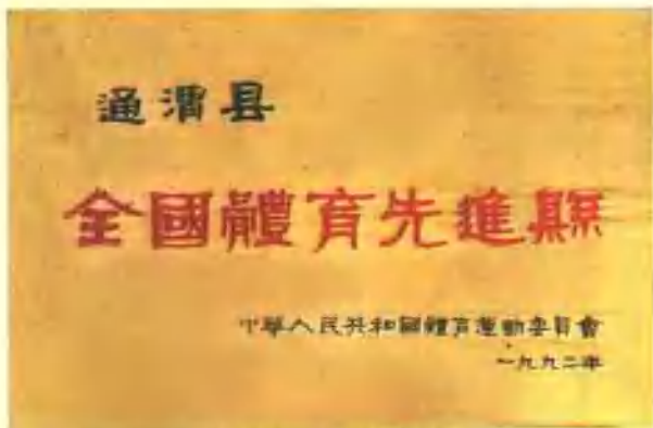
全国体育先进县奖牌