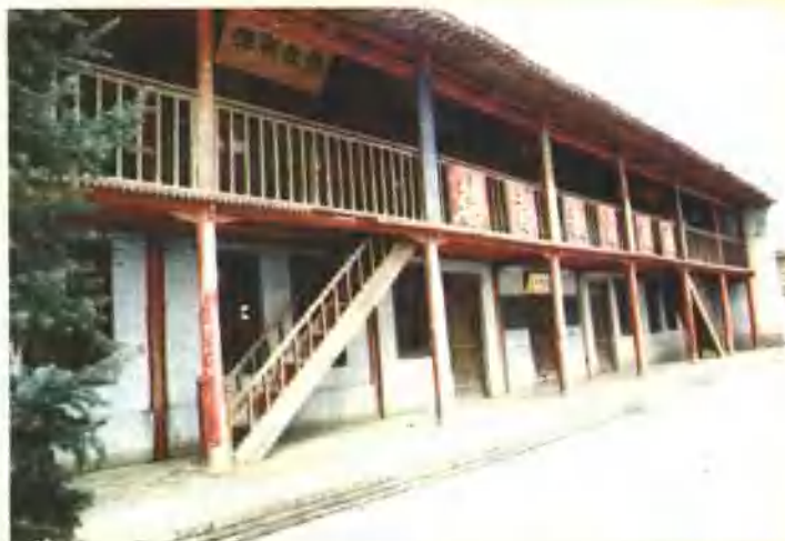
县级文物保护单位——通渭一中木楼