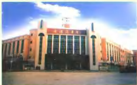
县公用型汽车站大楼