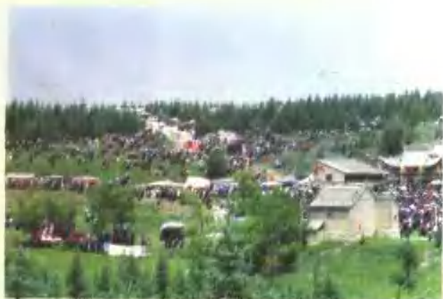
鹿鹿山端午节庙会