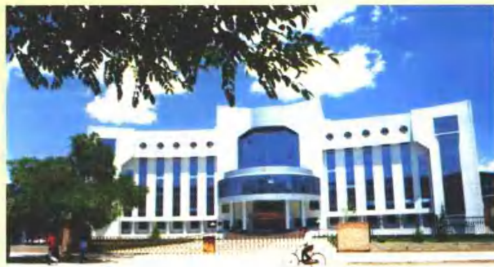
县人民政府办公大楼