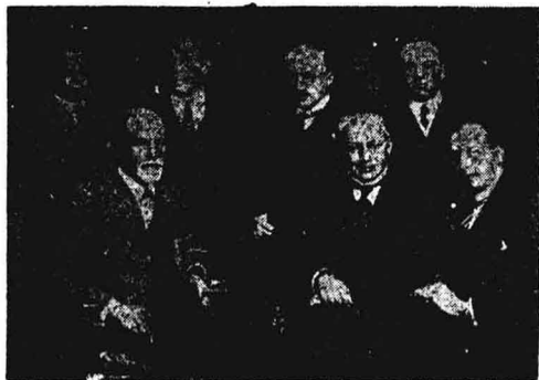
佛洛伊德與他的弟子們，佛洛伊德（前排左端）左手手指夾著雪茄

照佛洛伊德的說法，人類日常生活中的種種行為舉止，常常隱含著一種無意識的動機，連他本人也難以察覺。而這種無意識的動機在幼兒期時就已存在，這是佛氏精神分析學的重要論點。從此論點可知吸煙的行為，就是無意識的動機顯現在外的結果——在精神分析裏稱為象徵化。