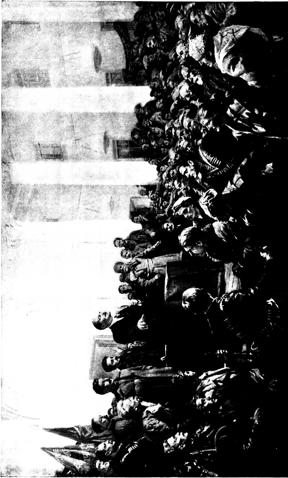
1. 政權歸於蘇維埃——和平歸於各國人民。油畫。一九五〇年。