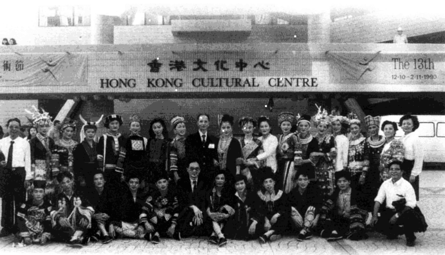
1990年10月带领广西少数民族歌手班参加第十三届香港亚洲艺术节