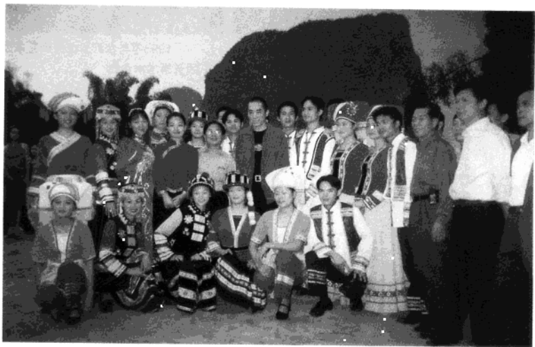
2003年带领歌手班学员与著名导演张艺谋在广西桂林市阳朔县漓江边合影