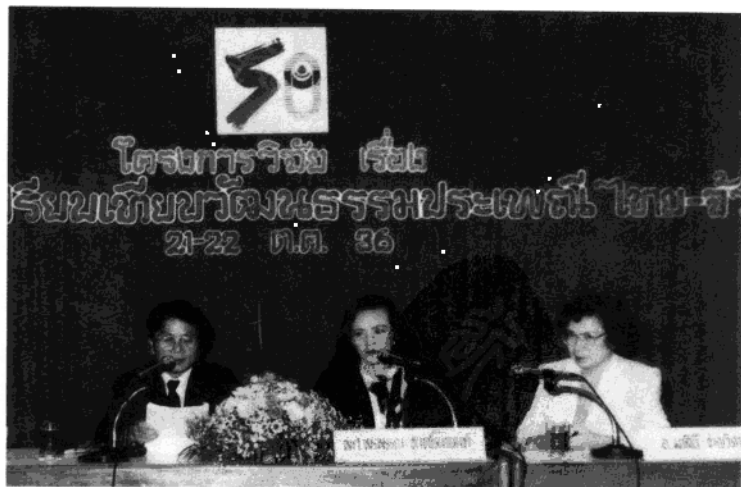
1995年在泰国曼谷参加壮泰传统民族文化研究，并在研讨会上宣读论文（旁边是英语和泰语翻译）