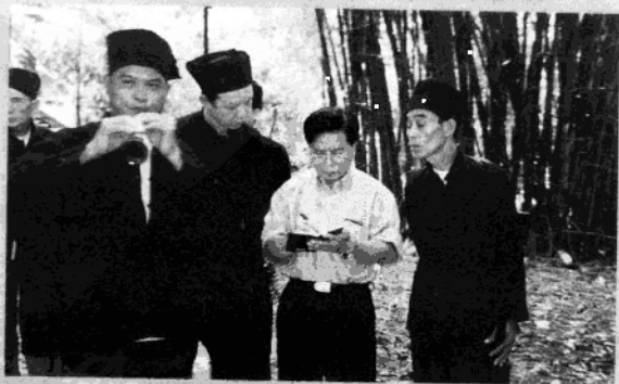
在广西龙州县板池村采访破咧民间艺人