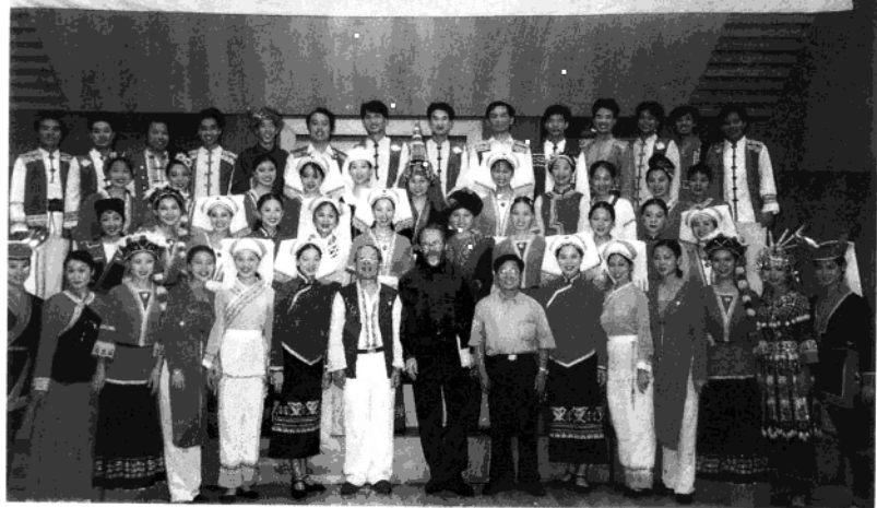
1998年8月带领广西少数民族歌手合唱团赴京演出时在北京音乐厅合影