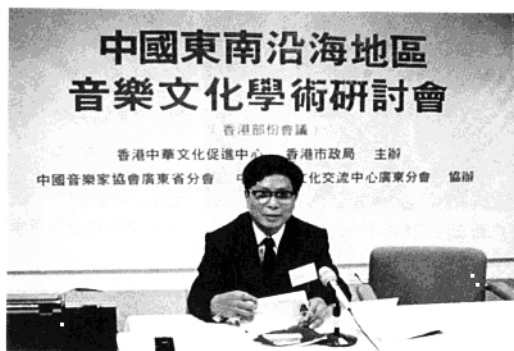
1990年10月在香港參加“中国东南亚地区音乐文化研讨会”，并在会上宣读论文