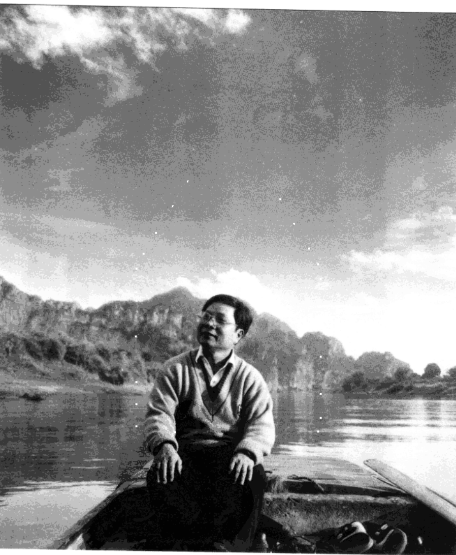
在广西南明县花山