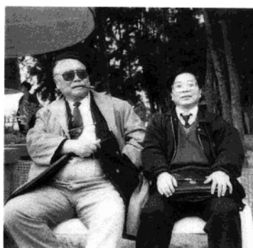
1993 年和中央音乐学院院长赵枫合影