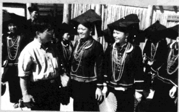
2004年和那坡县黑衣壮歌手在一起