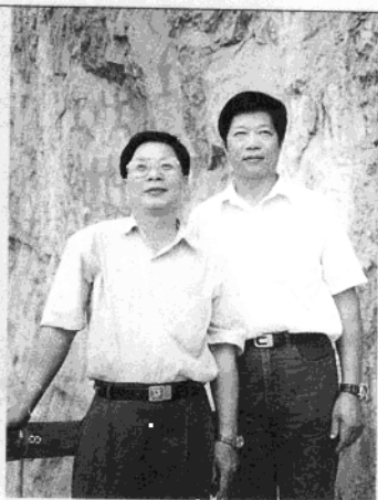
1995年和音乐家龙灿明在花山合影