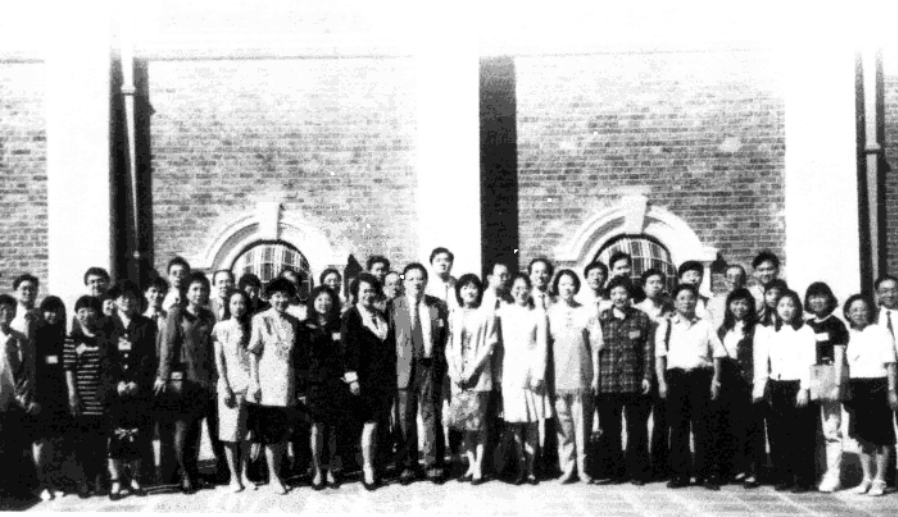
1996年中国传统音乐研讨会与会人员在香港大学合影