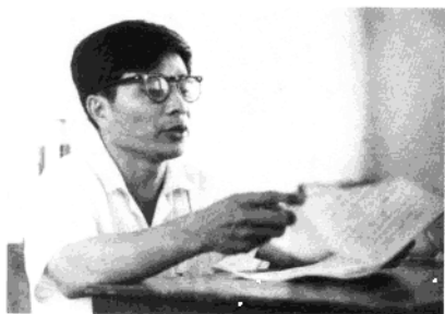
1984年3月17日在首届广西壮族自治区少数民族歌手学习班开学典礼上代表老师发言