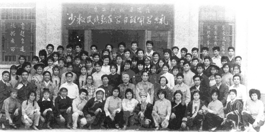
1984年3月17日首届广西壮族自治区少数民族歌手学习班(简称为:广西少数民族歌手班)在武鸣广西民族干校举行开学典礼