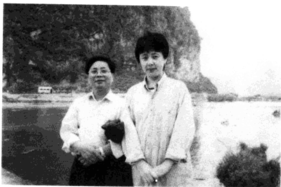
1998年和中央电视台主持人刘璐在靖西拍专题片《歌海情潮》