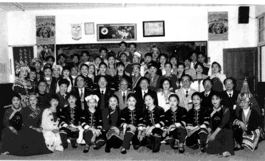
中国著名音乐家与广西少数民族歌手班学员合影