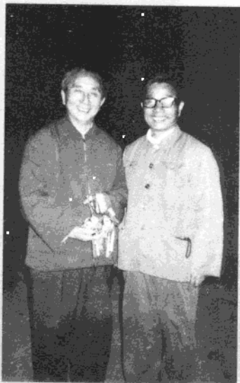
1985年与中国音乐家协会主席、著名音乐理论家吕骥在全国政协礼堂前合影