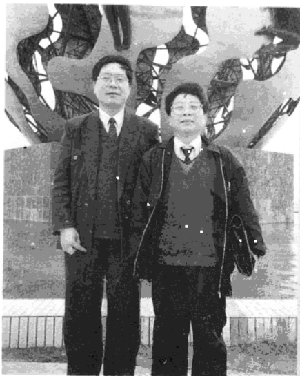
1992年与中央音乐学院院长樊祖荫合影