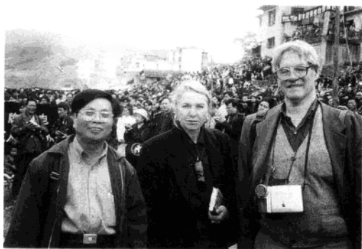
1998 年和美国学者在广西三江侗族自治县花炮节的合影