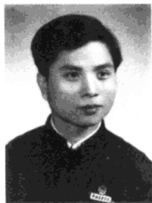
1962年就读于中央 音乐学院