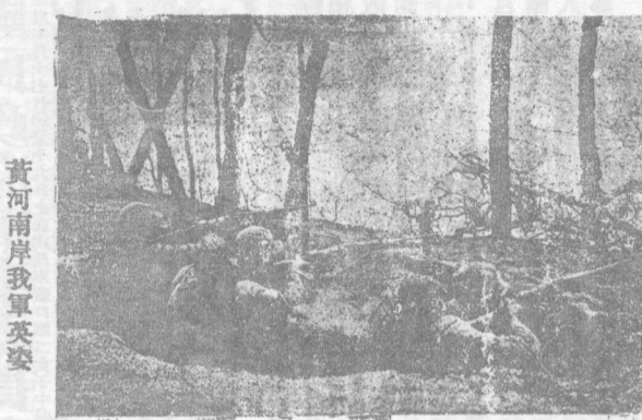
黃河南岸我軍英姿

參政會組織條例 第三條丁項遴選 甘介侯 黃炎培 聶雲台 施肇基 張君勱 沈鴻烈 張君勱 沈鴻烈 左舜生 張君勱 沈鴻烈 左舜生