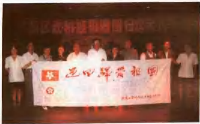
“迎回归，爱祖国”签名纪念