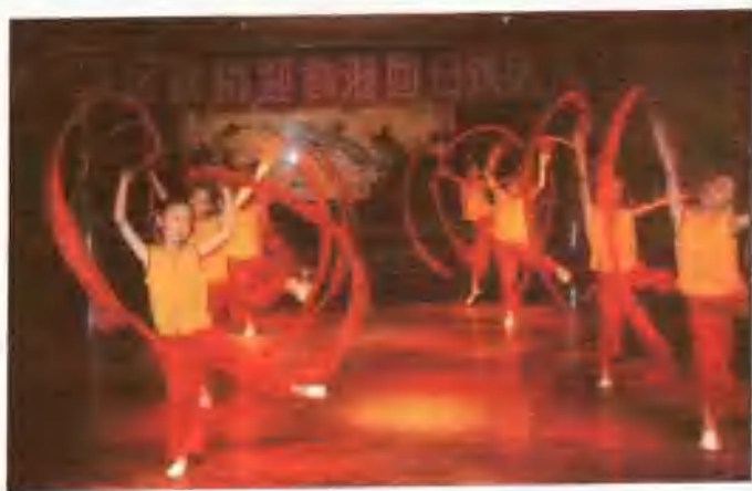
载歌载舞迎接香港回归祖国