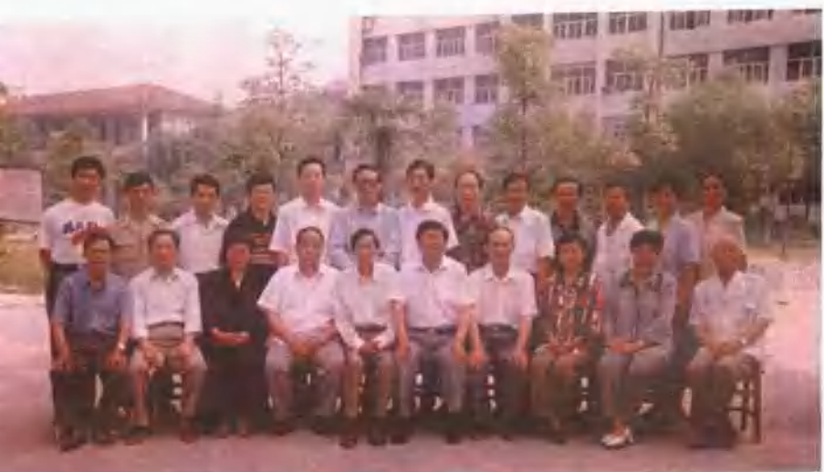
政协武陵区第八届委员会全体常务委员合影