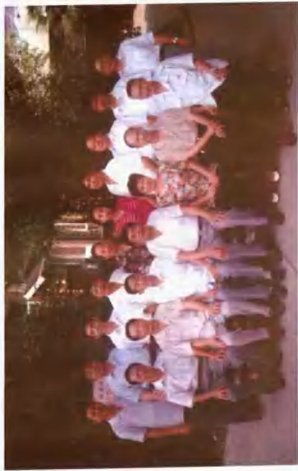
政协武陵区第八届委员会全体机关工作人员合影