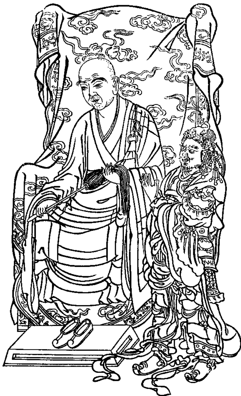
南 山 澄 照 大 師 像