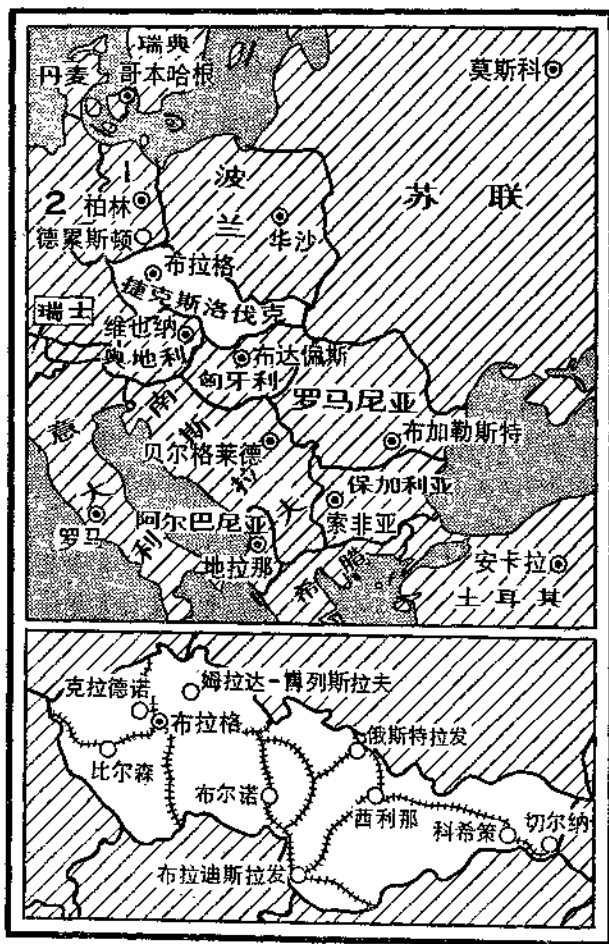
1 德意志民主共和国

对越南的侵略。他们在占领军的坦克上涂上象征法西斯的卐字。人们愤怒地高呼：“俄国杀人凶手滚回去！”