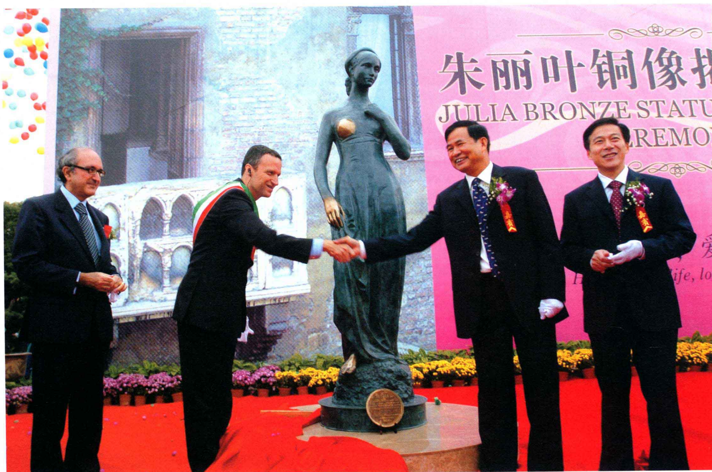
宁波市委副书记郭正伟（右二），宁波市委常委、鄞州区委书记寿永年（右一）与意大利维罗纳市市长佛拉维奥·托西（左二），意大利总统府办公厅主任迪托·利左（左一）共同为朱丽叶铜像揭幕