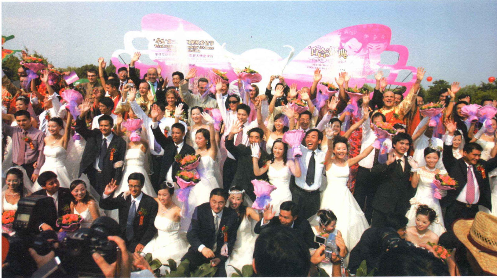
东西方两大爱情圣地首次联姻