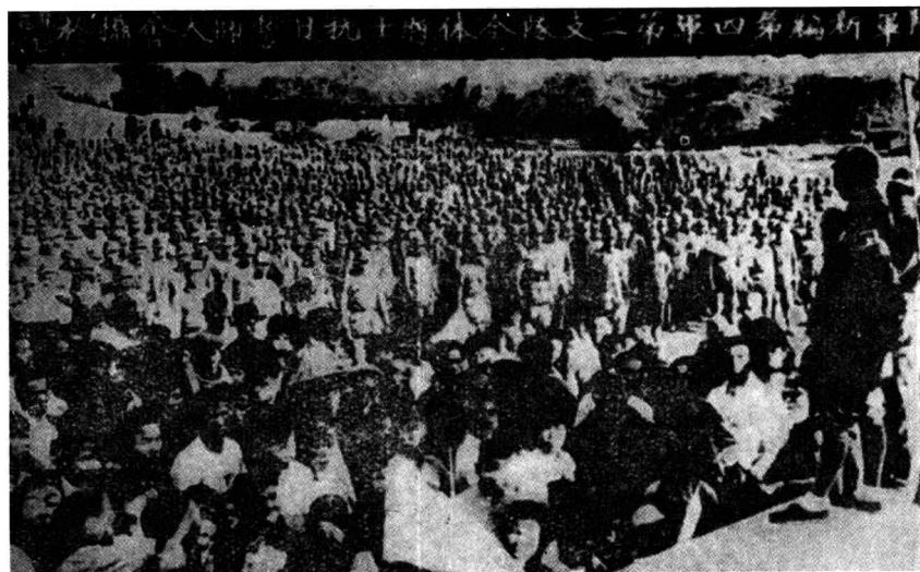
陆军新编第四军第二支队全体将士抗日誓师大会摄影