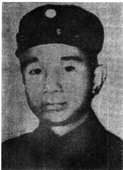
粟裕同志，一九三五年率红军挺进师进入闽东时，任师长。一九三八年率新四军先遣支队挺进江南敌后。