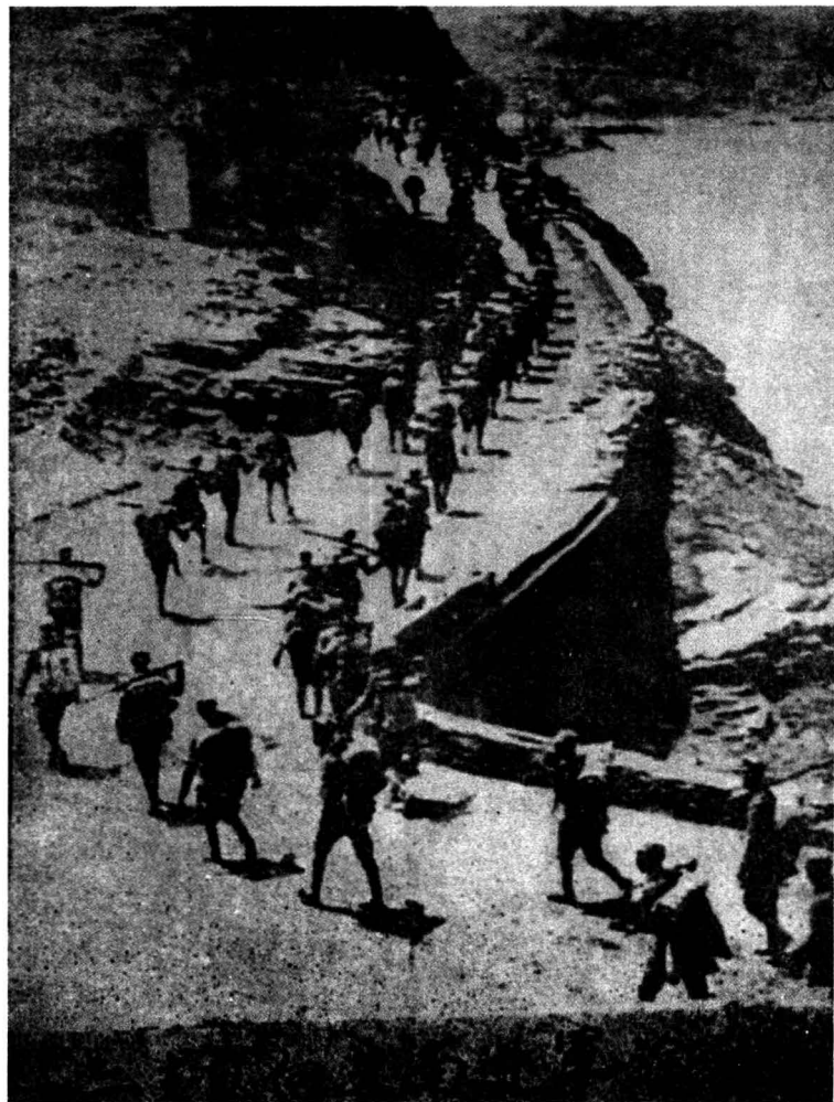
新四军一、二支队向江南进军途中