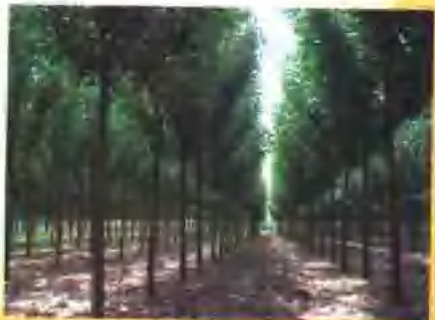
速生丰产林快速发展