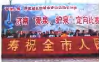
中国人寿山东省分公司积极参与社会公益事业