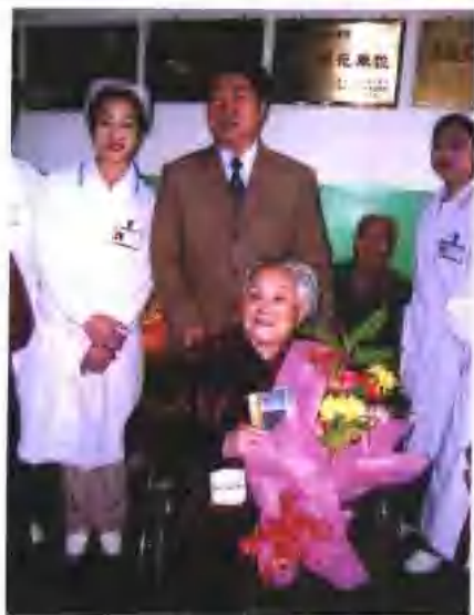
副省长谢玉堂与老年人共度老人节