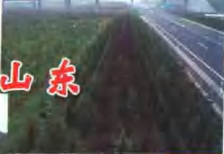
全省绿色通道2.3万公里,成为一道亮丽风景线