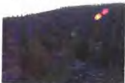
工程造林成为造林绿化的主要形式