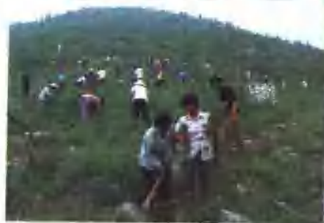
深入开展荒山绿化,全省生态环境不断改善