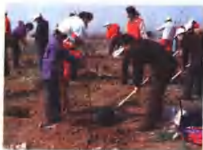
全省每年参加义务植树人数4000多万人,植树1.5亿株以上