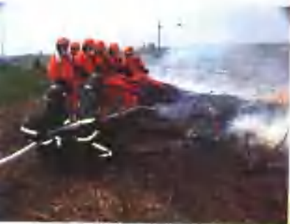
森林消防队员大练兵