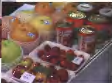
全省年产果品 130 亿公斤，果品加工业蓬勃发展