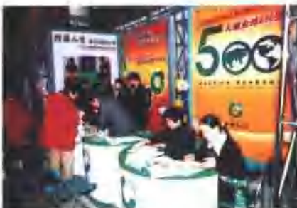
形式多样的咨询服务