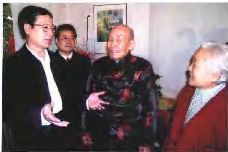
省委书记、省人大常委会主任张高丽春节走访慰问老年人