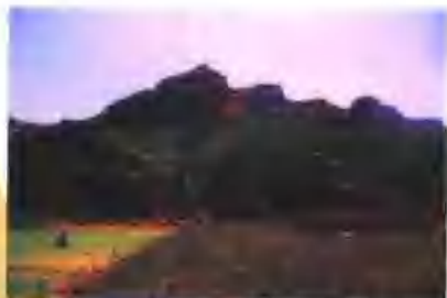
封山育林成效显著，全省山区森林覆盖率达到了 33%