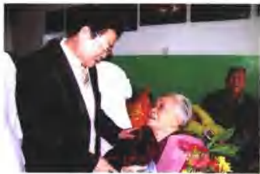
省老龄办主任褚庆观到老年公寓看望老人。