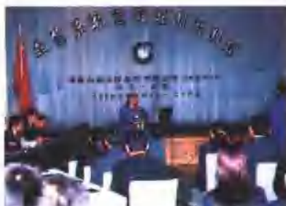
有声有色的业务培训