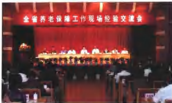
全省养老保障工作现场经验交流会