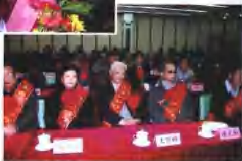
志愿援助菏泽的农业、教育、医疗卫生等行业的老专家