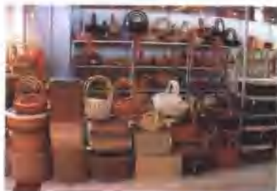
全省林业企业达 3.5 万家，林产业总产值达到 538 亿元