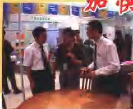
全省林产品经贸交流活动日趋活跃