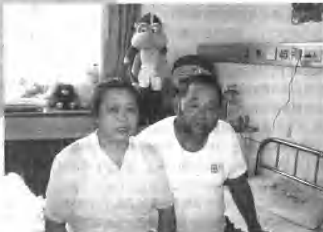
爸爸妈妈焦急地在等待手术的消息

“三条腿”属于先天性畸形，原因有多种。比如母亲怀孕早期得了病毒性感冒和风疹等。孕妇接受了放射性治疗或服用了某些药物。另外，女性服用避孕药停药后短期内怀孕，也会导致畸形的发生。