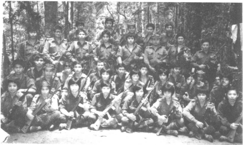
活跃于彭亨、雪兰莪部份“六突”队员合照。