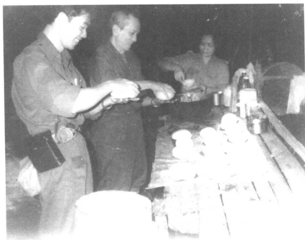
队员们正在烹调大包。