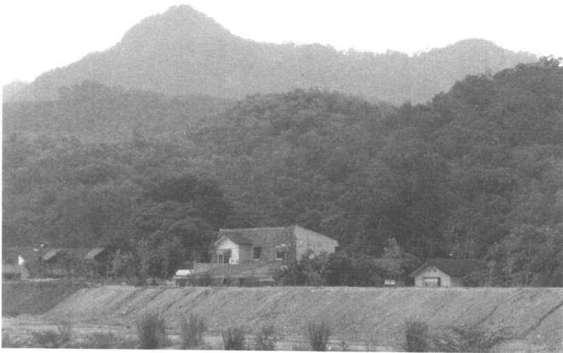
这是当年六突活动的骆驼峰。