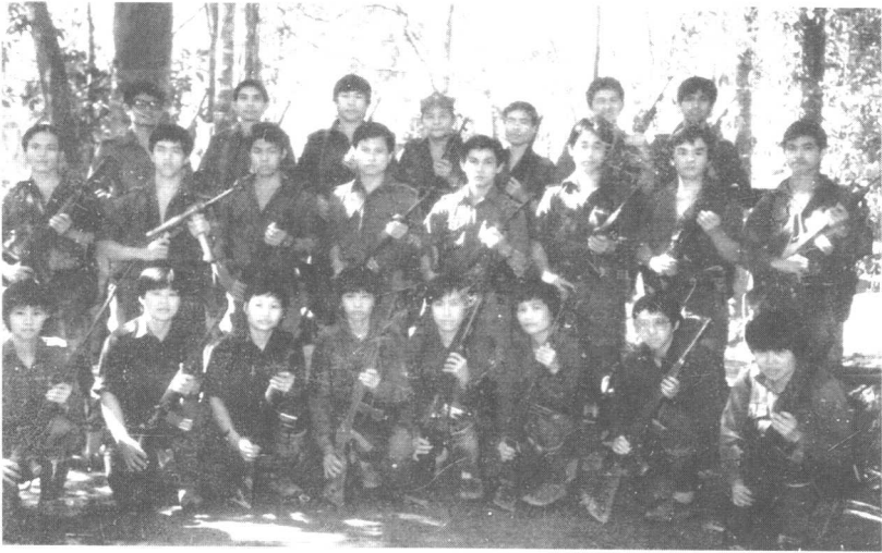
活跃于彭亨、雪兰莪部份“六突”部分队员合照。