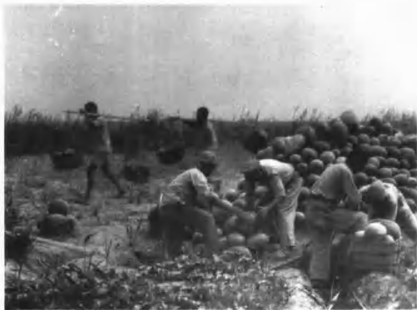
1951年，二军四师在伽师喜获甜瓜丰收