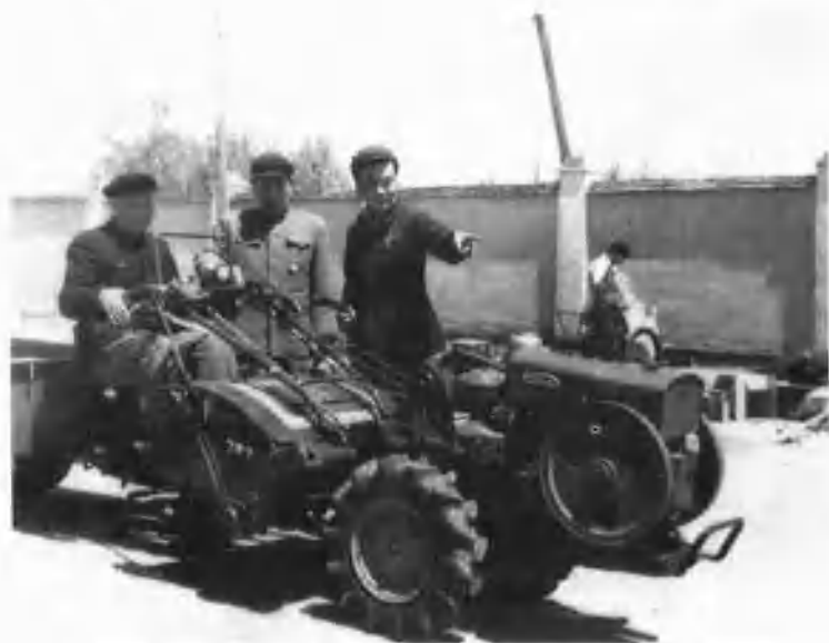
1950年春，二十二兵团成立了第一个机耕队，陶峙岳司令员高兴地坐上轻型拖拉机说：“机械化是发展农业的保证。”