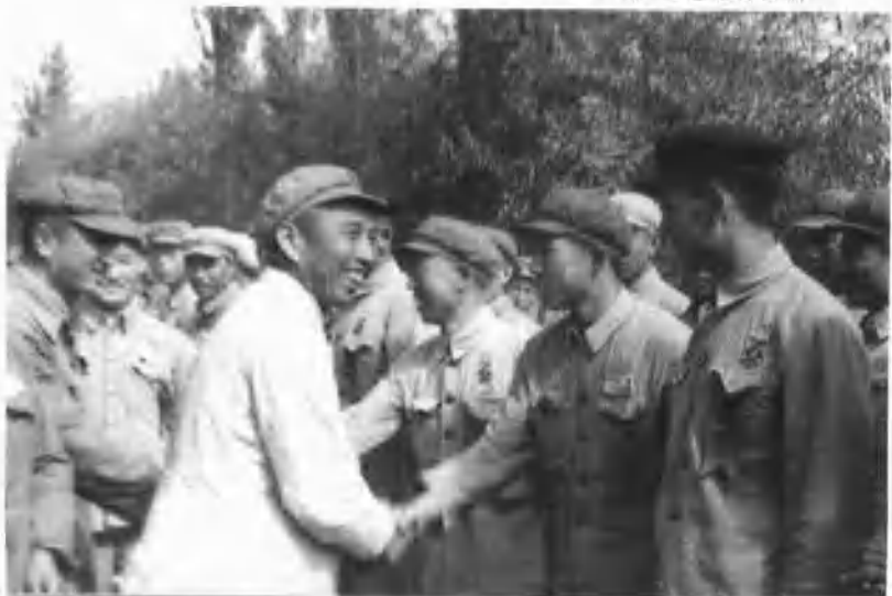
1951年8月1日，王震将军亲切接见二军兼喀什军区首届党代表大会代表