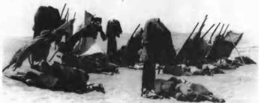
冰天雪地，战士以抬把档风工间休息