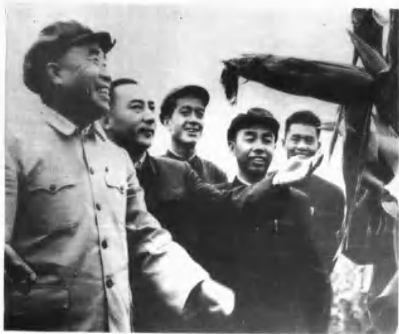
1958年9月，国家副主席朱德（左一）来新疆视察石河子垦区农田。左二为自治区主席赛福鼎·艾则孜，右二为农八师政委鱼正东