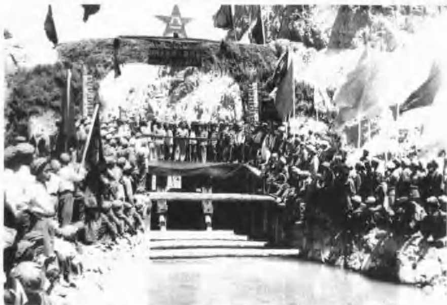
1951年，王震司令员为十六师创建的红星渠剪彩开闸放水。