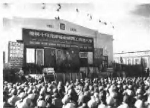
十月汽车修配厂 开工典礼大会现场 (陈荫椿)

1953年，王恩茂书记(左一)、贾库林、赛福鼎(左二、左三)在塔湖梁电厂工地检查工作 (陈荫椿)