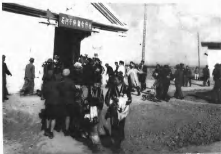
1951年，石河子供销社门庭兴隆