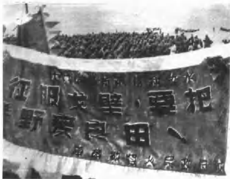
1951年6月，库尔勒县人民政府向十八团大渠修建者献上锦旗