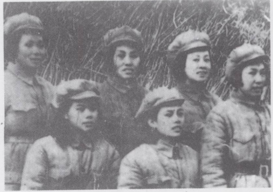
一九四六年冬北撤山东后,在东纵妇女队时拍的照片。