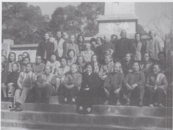
莞城地区东江纵队女战士合照