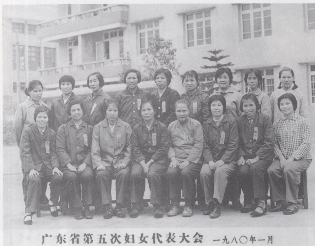
广东省第五次妇女代表大会 一九八〇年一月