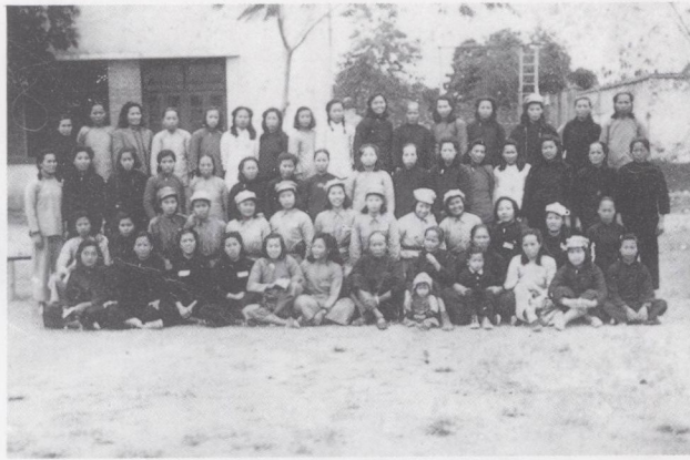
一九五〇年三月莞城婦女代表大會代表留影