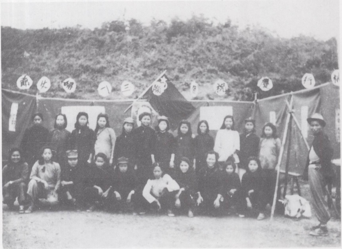
粤赣湘边纵一支三团部份女战士一九四九年国际三·八妇女节留影