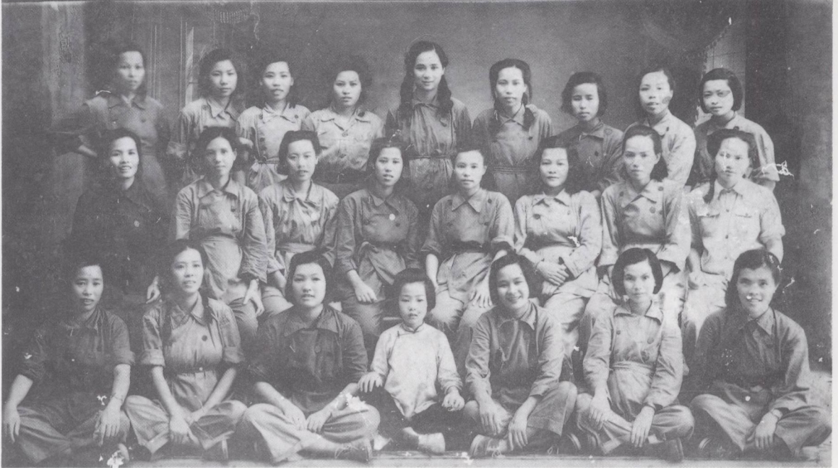
東莞縣婦委第四次婦工會議代表留念