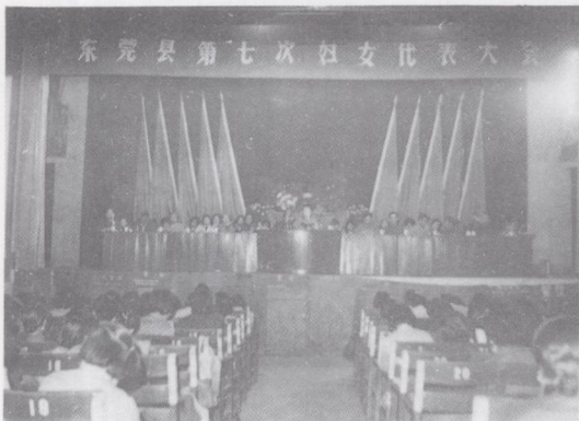
东莞县第七次妇女代表大会