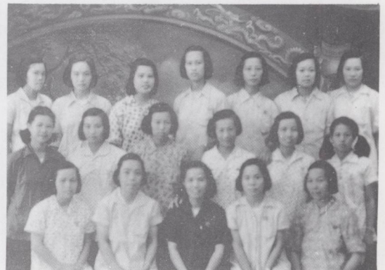
一九五六年八月部分妇女干部合影