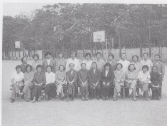
一九八七年三月十五日纪念中国人民解放军粤赣湘边纵一支三团成立三十九周年莞城地区战友叙会与会全体卫生战士合照