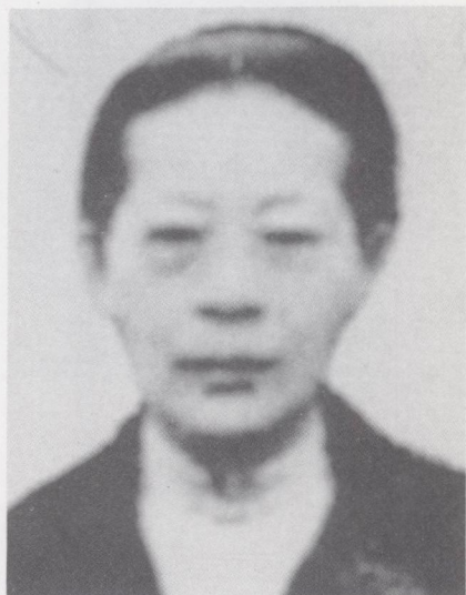
李淑恒一九三八至四一年先后带领六个儿女从香港回来参加我党领导的东江人民抗日武装。她一九四一年九月在大岭山英勇就义