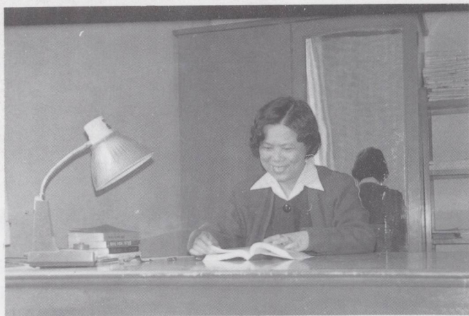
中共中央委员、全国妇联副主席、广东省委副书记张帼英同志