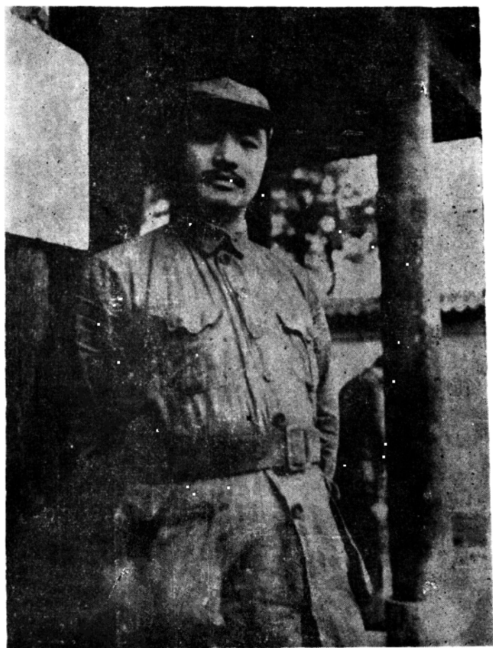
转战石门时期的贺龙元帅