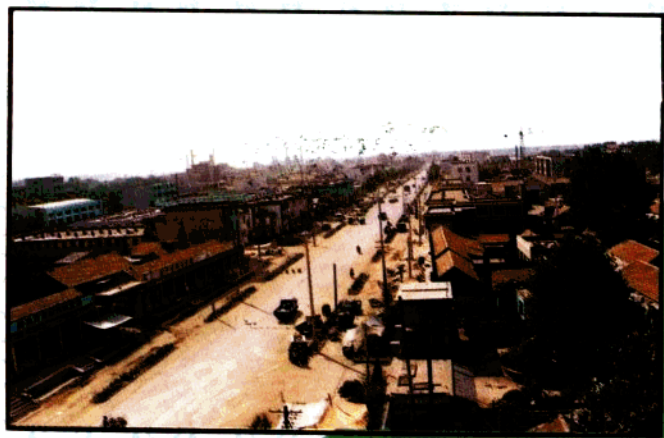
● 镇政府驻地商业一条街