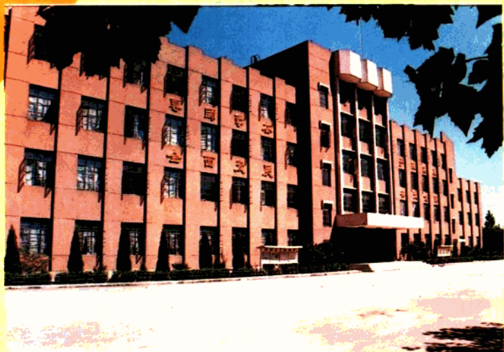
● 郭店镇中学教学楼