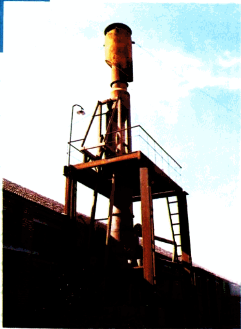
● 历城区选矿厂冲天炉