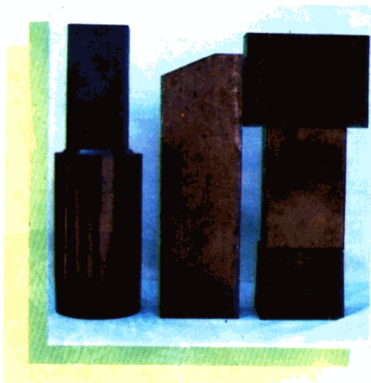
● 济南市镁碳砖厂组照