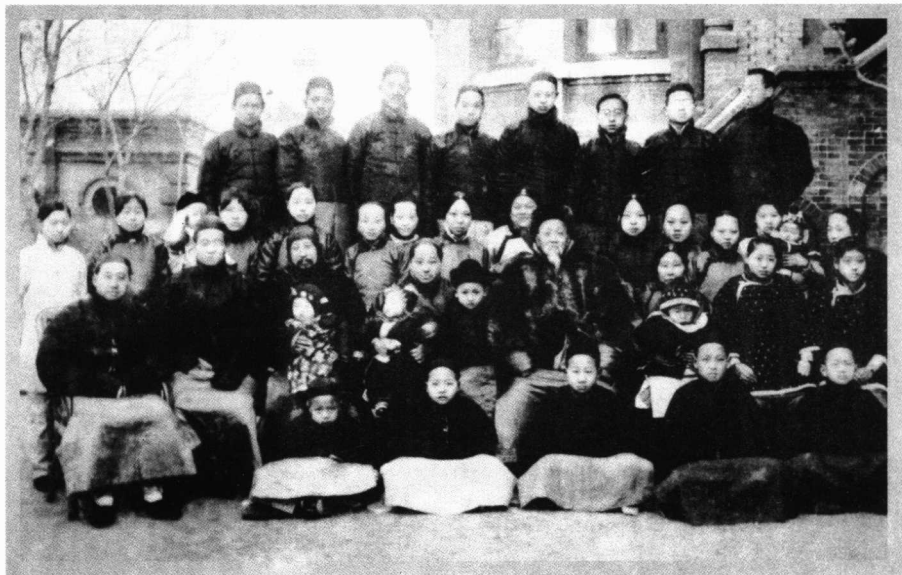
周馥及其在津家族合影(1919或1920年摄于周学辉家)