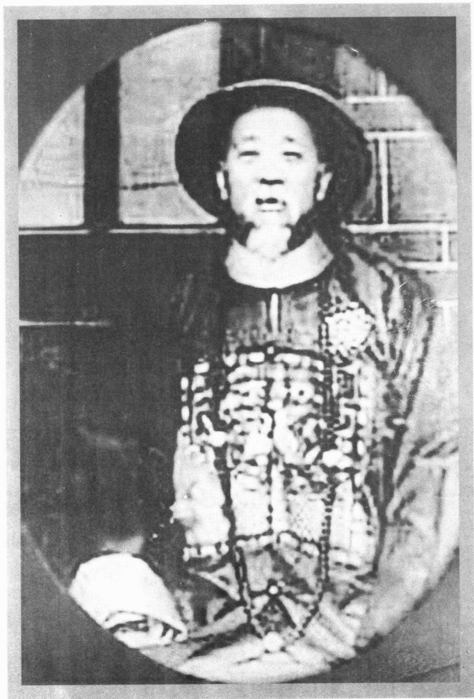
周馥在两江总督任所之官服照