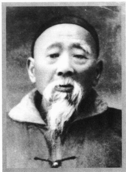
周馥晚年在天津便服照