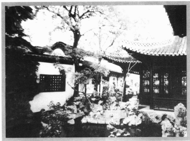
周馥之扬州小盘谷故居