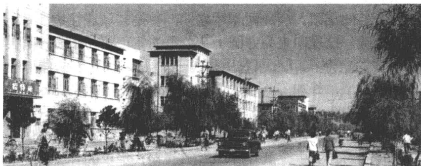
昌图县城建筑新姿