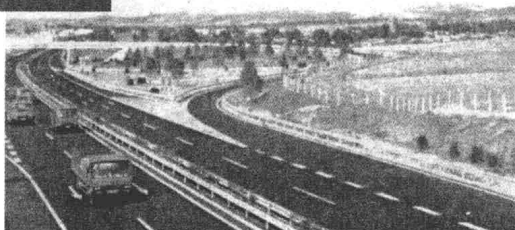
沈哈高速公路昌图出入口