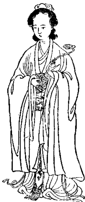
唐女道士魚元機小影 秋室燕莛圖作