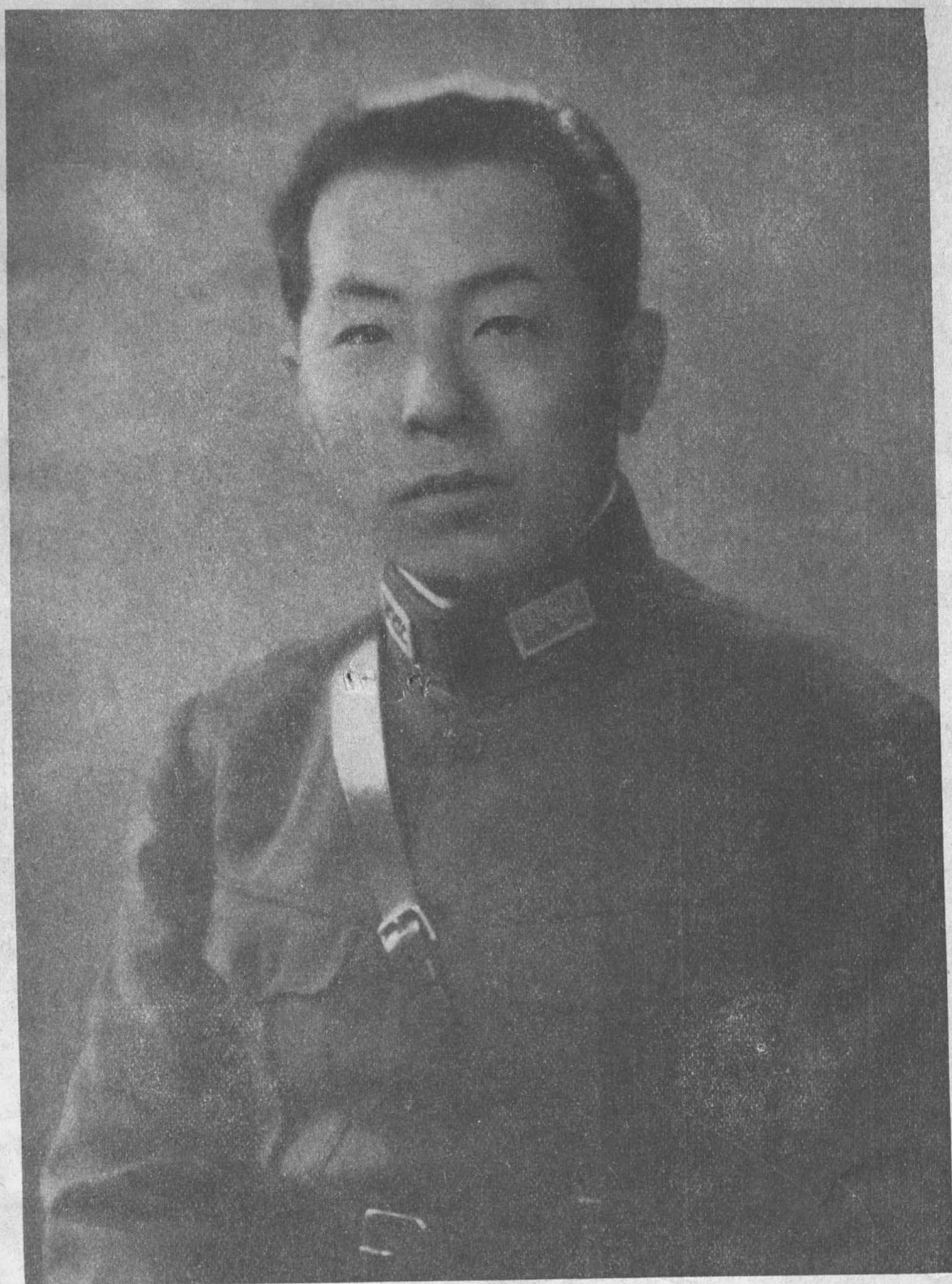
長 員 委 代 會 分 員 委 事 軍 平 北 Gen. Chang Hsueh Liang, Chairman of the Military Affairs Commission of Peiping.