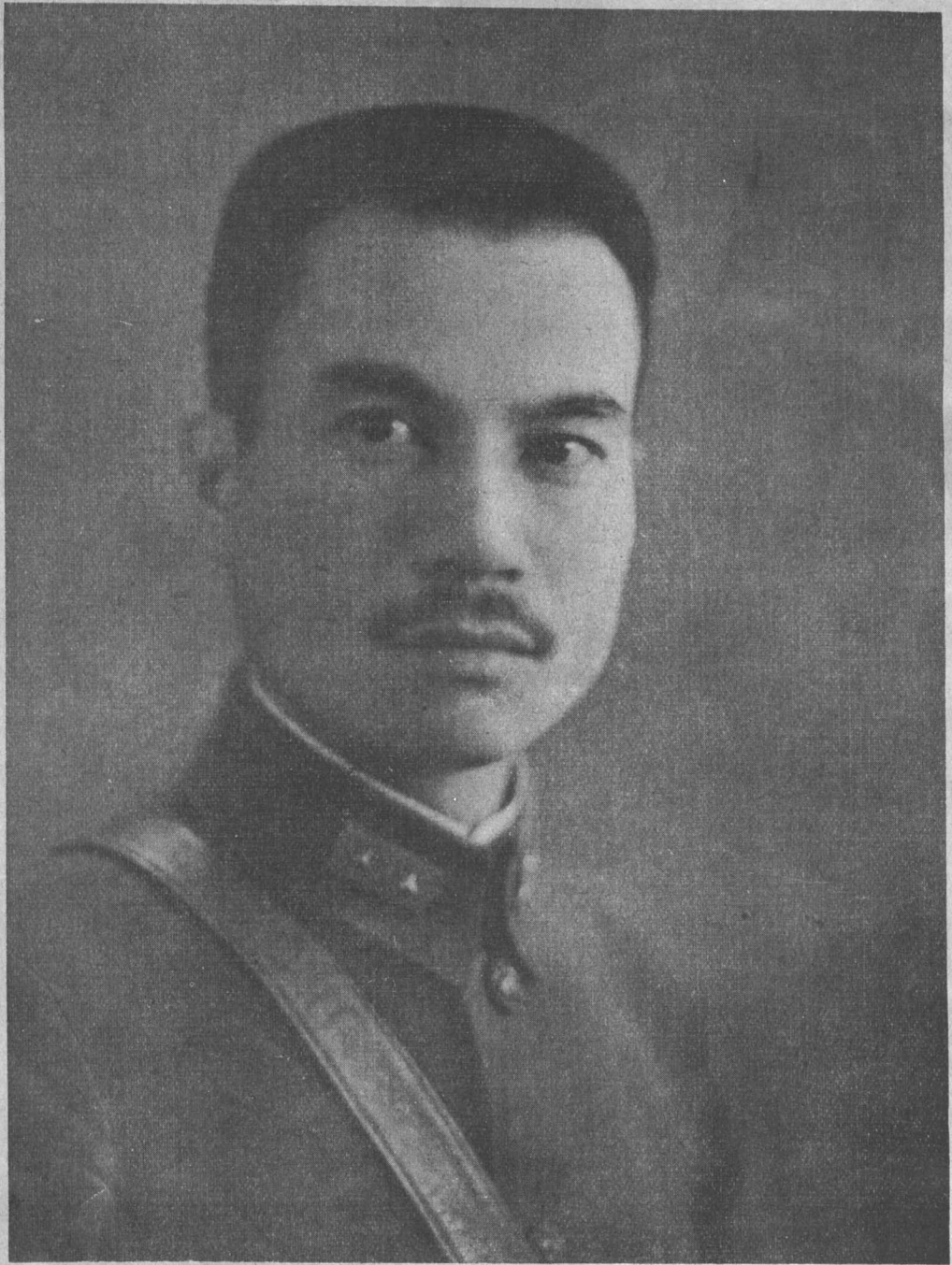
榆中戰忠勇抗戰之第五十七軍軍長前第九旅旅長兼永警備司令 Gen. Ho Chu-Kuo, the heroic and brave commander-in-chief of the bloody fight in Shanhaikuan.