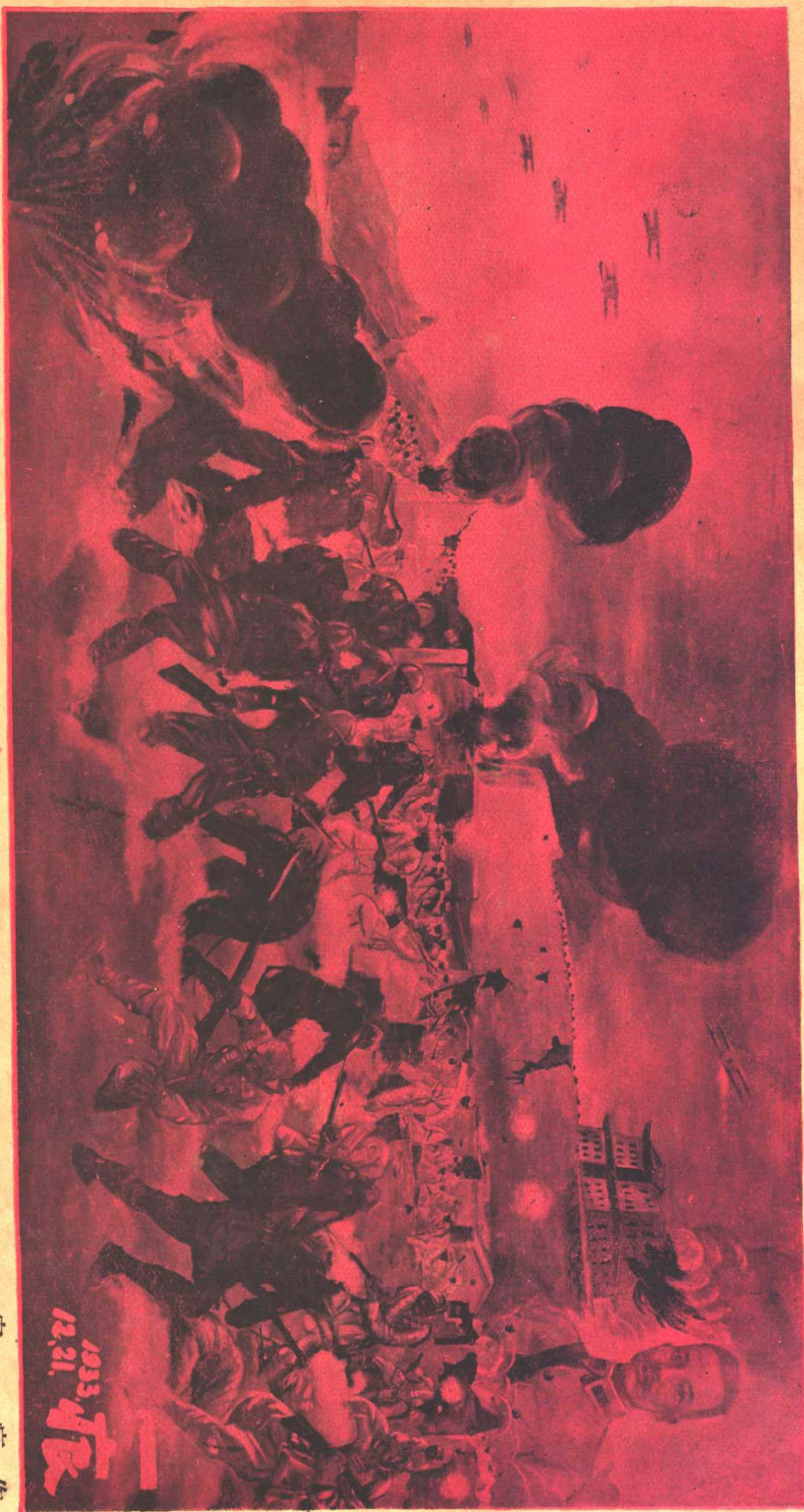
一九三三年之榆關抗日戰爭 The War against Japanese Imperialism at Shanghaikuan on Jan. 1st. 1933.