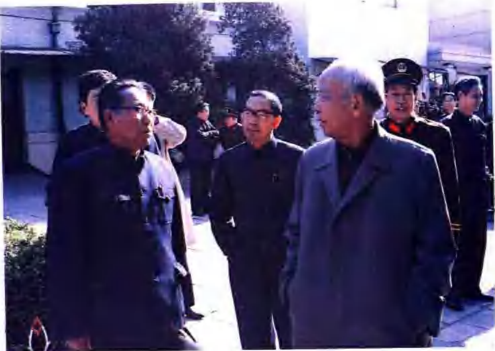
▲ 萬里同志1985年視察德州