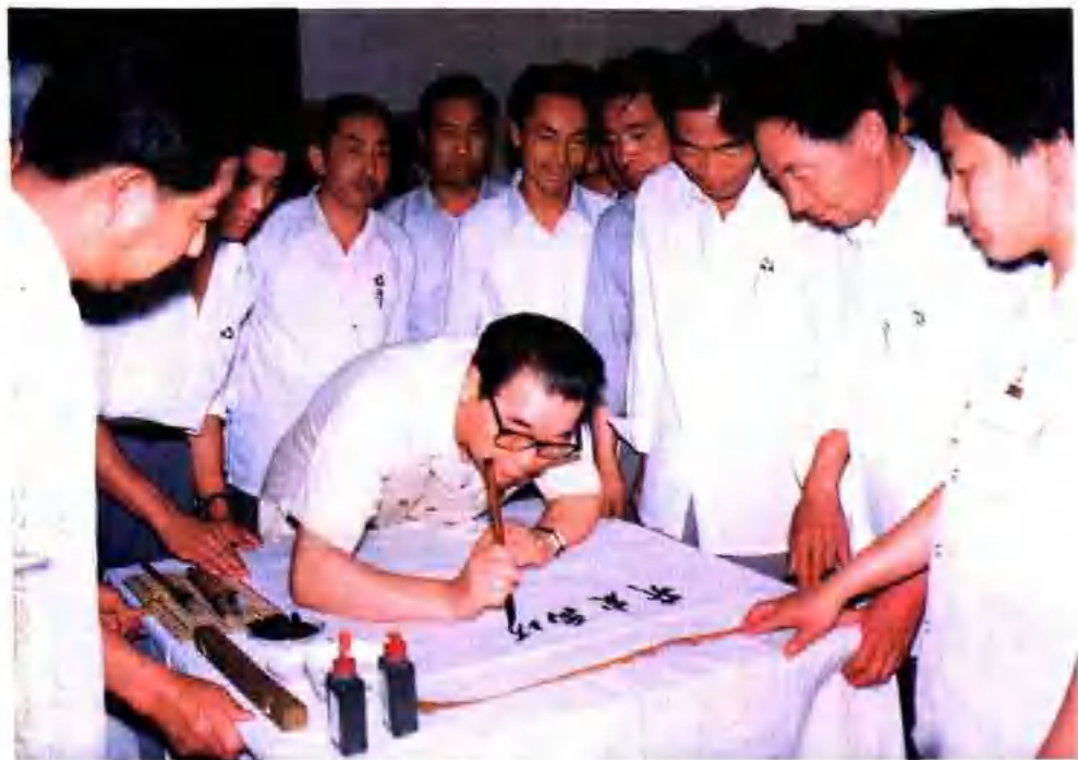
▲ 李鵬同志1988年6月18日視察禹城