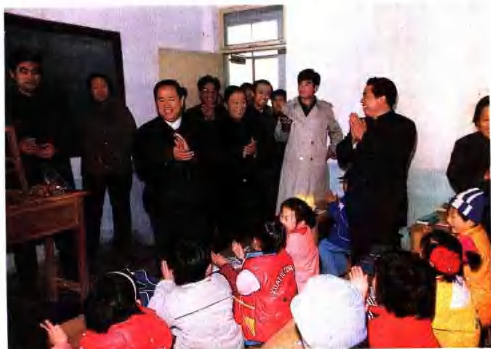
▲ 姜春雲同志視察齊河縣實驗小學