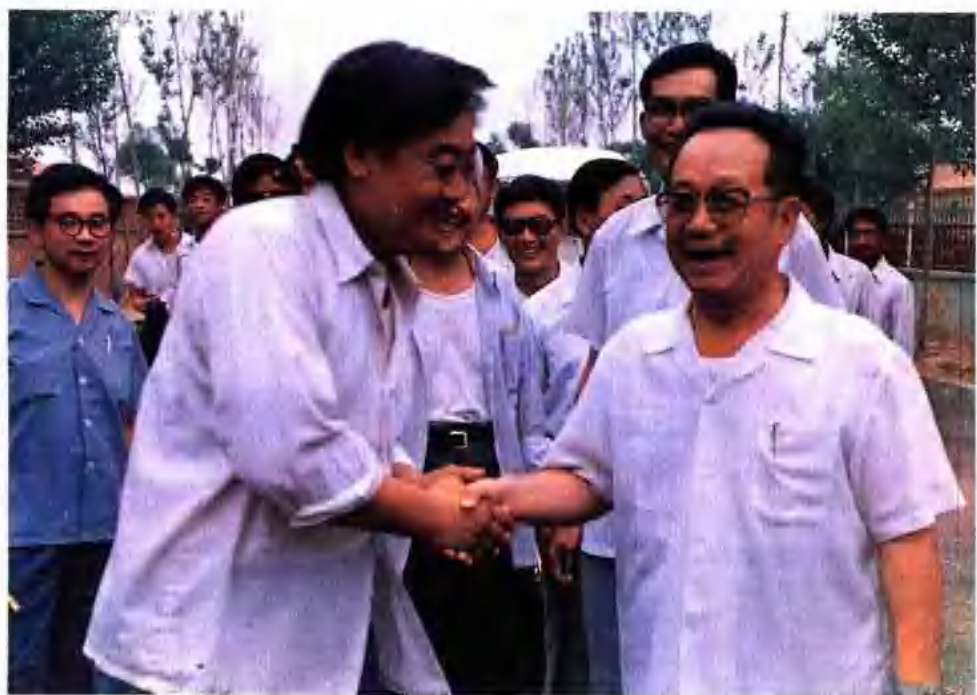
▲ 谷牧同志1985年視察陵縣張西樓村