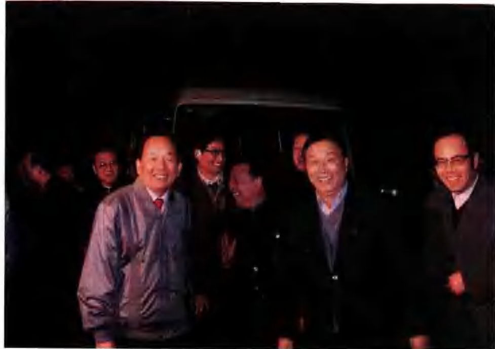
▲ 田紀雲同志1990年來德州視察