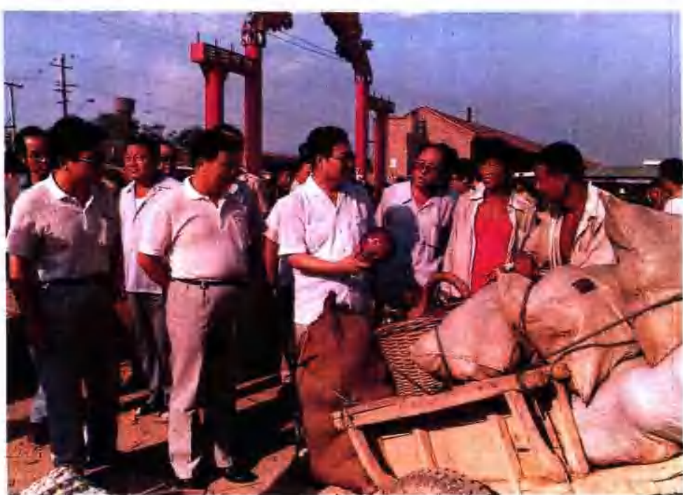
▲ 趙志浩同志視察慶雲縣蔬菜批發市場