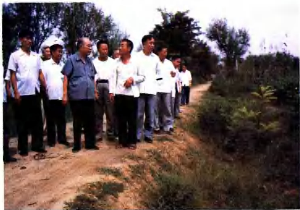
▲ 姚依林同志1982年8月視察陵縣