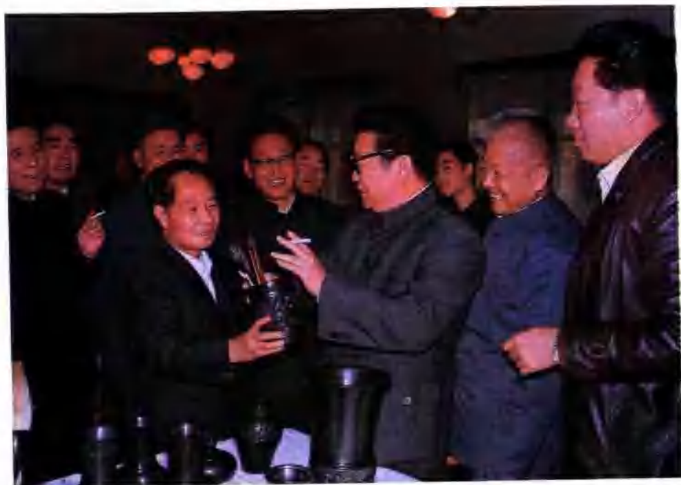
▲ 胡耀邦同志1986年11月4日在德州賓館欣賞黑陶