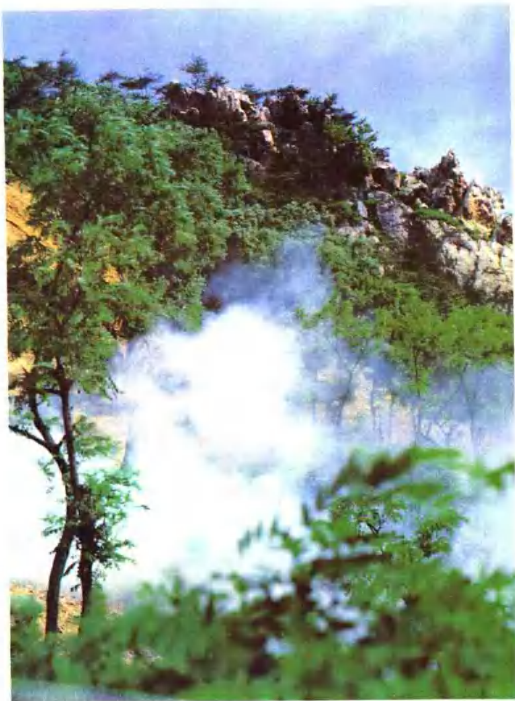
雄浑秀灵的玲珑山