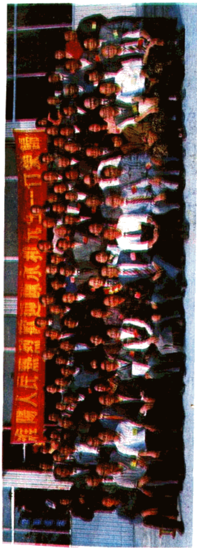
重慶陳胡公墓落成典禮暨陳氏祭祖大會全體與會人員合影