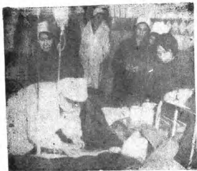
理操作技术表演赛图为静脉输液比赛 中华护理学会鹤壁分会组织护理人员开展护