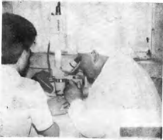
市第一人民医院微循环测定仪 应用于临床。

市第一人民医院、矿务局 职工医院积极开展显微外科手 术，右图为市第一人民医院应 用手术显微镜做动物实验手 术。