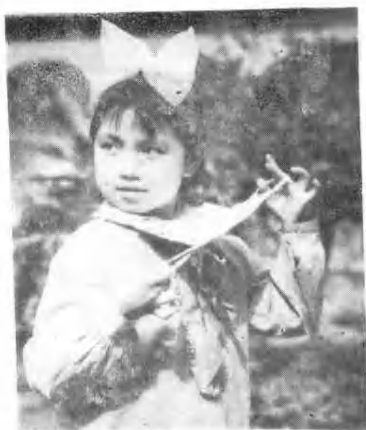
讲究卫生预防疾病