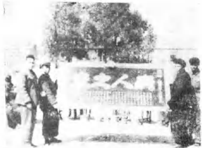
全体住院病员给市人民医院赠匾（1959年）