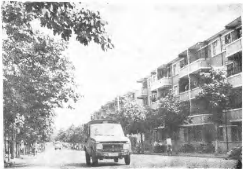
整洁的春雷路大街