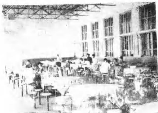
鹤壁矿务局第五煤矿职工食堂，宽敞、明亮