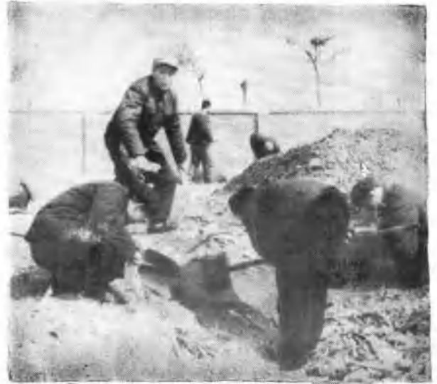
下图为市直机关干部在挖蝇蛹