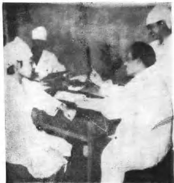
市第一人民医院内科讨论治疗方案