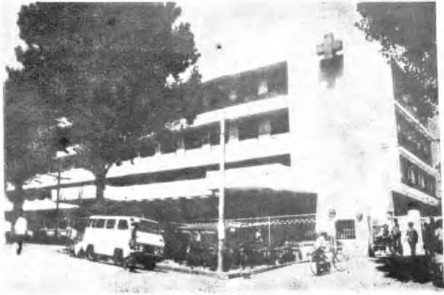
市第一人民医院门诊楼