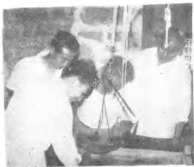
市委领导深入“地甲病”重病区检查碘盐存放情况