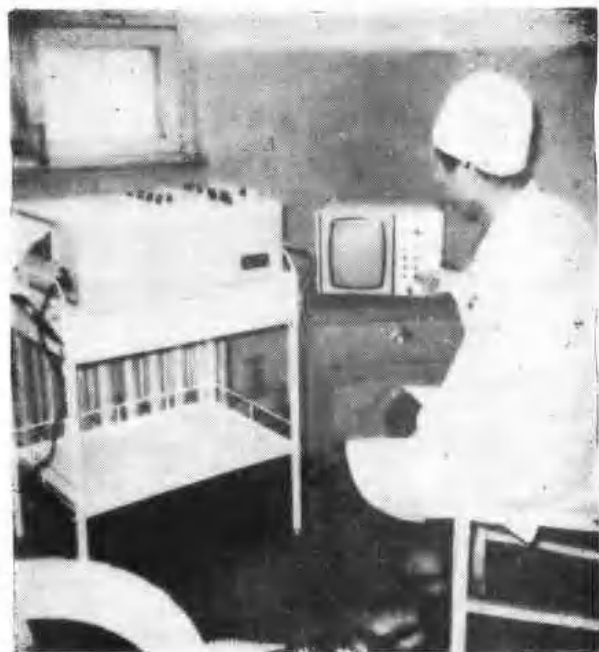
鹤壁矿务局职工医院脉象仪应用于临床