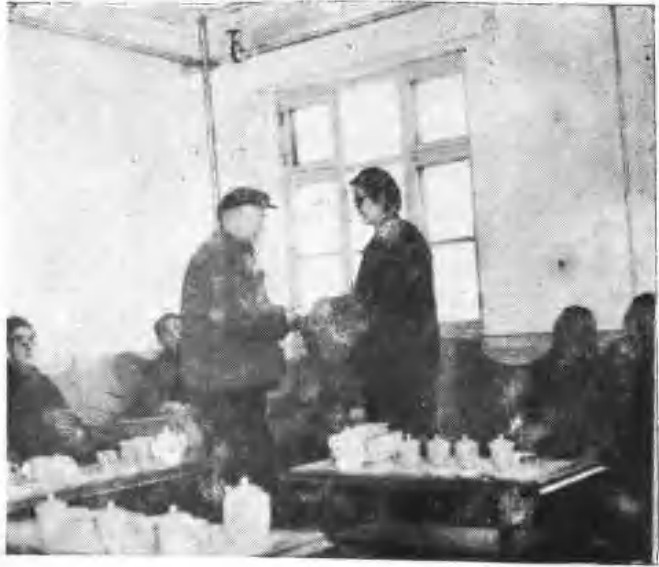
老中医向市委领导献祖传秘方