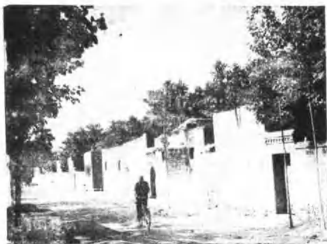
市郊农民新村马庄