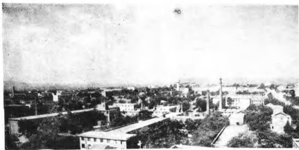
矿务局职工医院鸟瞰