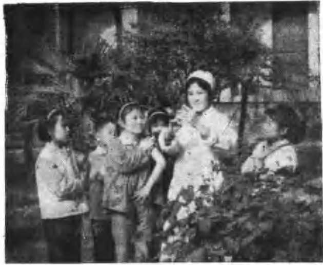
预 防 接 种