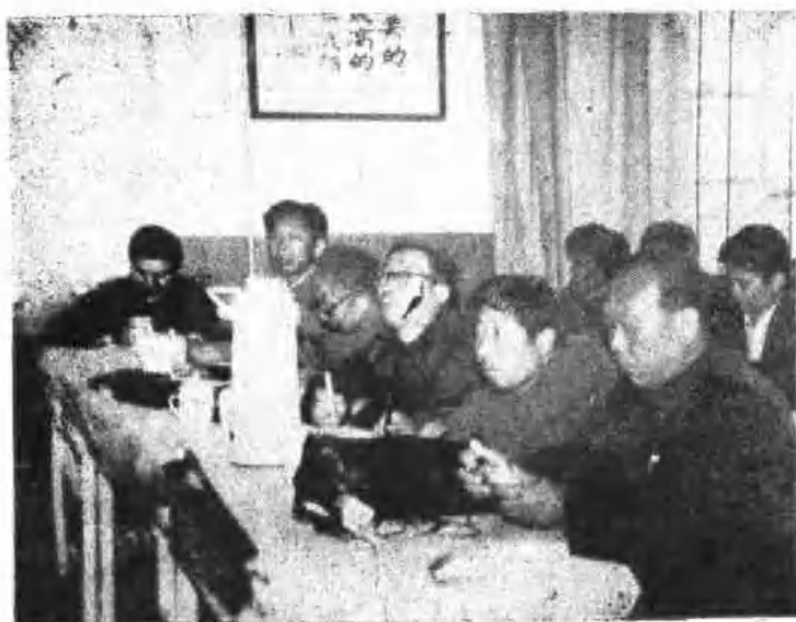
中华医学会鹤壁分会积极开展形式多样的学术活动 上图为医务人员认真听学术报告