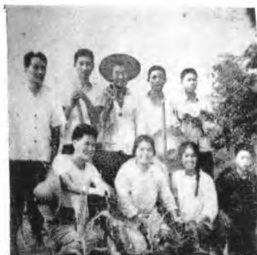
图为市人民医院医务人员带领乡村医生采集中草药