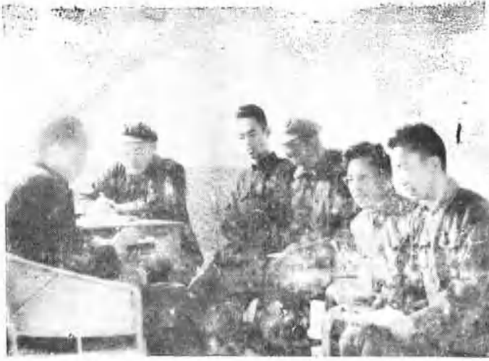
市人民医院领导制定医院规化（1958年）