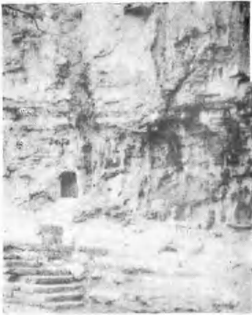
上图为鹤壁市郊五岩山孙真人洞