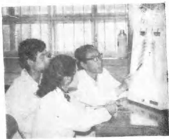
职业病防治人员在读片