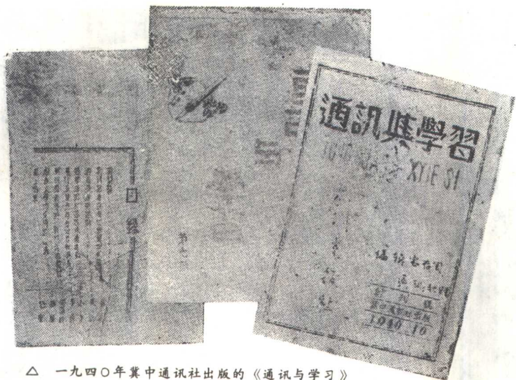
△ 一九四〇年冀中通讯社出版的《通讯与学习》第一期（红黑套色）和一九四一年《通讯与学习》第七期（红绿套色）及第七期目录