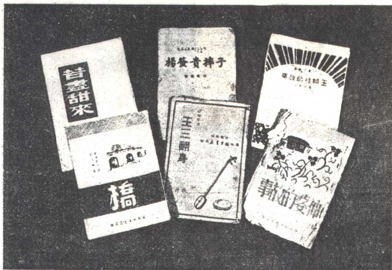
解放战争时期冀南的部分作品