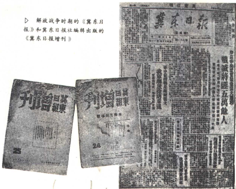
▷ 解放战争时期的《冀东日报》和冀东日报社编辑出版的《冀东日报增刊》